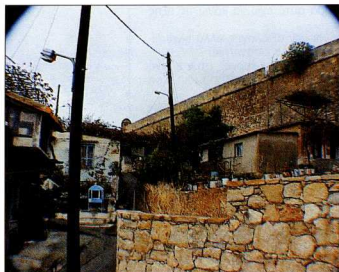
5. Οικισμός Χαράκια. Δρόμος στο εσωτερικό του οικισμού. Οι σικιές πάνω στο τείχος δείχνουν το ενδιαφέρον για τη συντήρησή του.