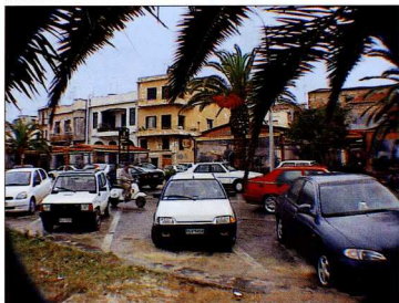
9. Παραλιακή λεωφόρος Ελ Βενιζέλου. Οι κωνοφόροι χώροι έγιναν καταστήματα με ... νάϊλον.