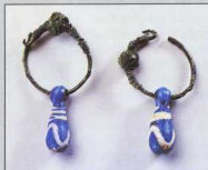
6. Ζεύγος χάλκινων ενυπίων με στέλεχη από υαλομαζα (10ος - 11ος αι.). Σπίλος Αποκορώνου.