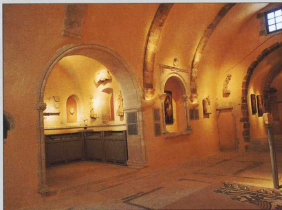
4. Άποψη του εσωτερικού. Βόρεια πλευρά.