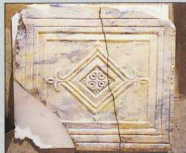
7. Αμφιπόροιο θυράκιο με γεωμετρική διακόσμηση (6ος αι.). Λατζανά Κισσάμου.

την αρχιτεκτονική του χώρου επέβαλε ορισμένες αλλαγές στη χρονολογική σειρά της παρουσίασης των έργων, χωρίς όμως να διακόπτεται ο παιδευτικός χαρακτήρας της έκθεσης. Ένα τμήμα ψηφιδωτού δαπέδου από το Καστέλι Κισσάμου, κιονόκρανα, θυράκια και επιτύμβιες επιγραφές σκιαγραφούν συνοπτικά την παλαιοχριστιανική περίοδο, ενώ η δεύτερη βυζαντινή περίοδος αντιπροσωπεύεται κυρίως από αποσπαιγμένες τοιχογραφίες. Οι περισσότερες προέρχονται από το ναό της Αγίας Βαρβάρας στα Λατζανά Κισσάμου (11ος αι.), ενώ δύο αποσπαιγμένα τοιχογραφιών είναι έργα του ζωγράφου Θεόδωρου Δανιήλ Βενερέη (1292). Εκτίθενται ακόμη αρχιτεκτονικά γλυπτά από την περίοδο της ενετοκρατίας καθώς και εικόνες που χρονολογούνται από τον 15ο μέχρι τον 17ο αιώνα. Ιδιαίτερα σημαντική είναι η μικρή εικόνα με την παράσταση του Αγίου Γεωργίου, έφιππου δρακοντοκτόνου, έργο του Εμμανουήλ Τζάνε. Εκτίθεται επίσης αξιόλογη συλλογή βυζαντινών νομισμάτων και μολυβδοβούλλων καθώς και νομισμάτων της ενετοκρατίας. Η Συλλογή συμπληρώνεται με αντικείμενα μεταλλοτεχνίας, μεταξύ των οποίων και ένα σπάνιο αγγείο ισλαμικής τέχνης που χρονολογείται πιθανότατα στον 10ο αιώνα, κοσμήματα, τα οποία βρέθηκαν κυρίως σε τάφους, καθώς και έργα κεραμικής. Χάρτης, χρονολογικός πίνακας και επεξηγηματικά κείμενα καταποίζουν τον επισκέπτη σχετικά με την ιστορική διαδρομή της πόλης και του νομού Χανίων, καθώς και για την προέλευση των εκθεμάτων.