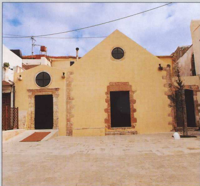
1. Όψη του ναού San Salvatore (Παλιά Πόλη Χανίων), όπου στεγάζεται η Συλλογή.

Αρχαιολόγος, Διεύθυνση Βυζαντινών και Μεταβυζαντινών Μνημείων