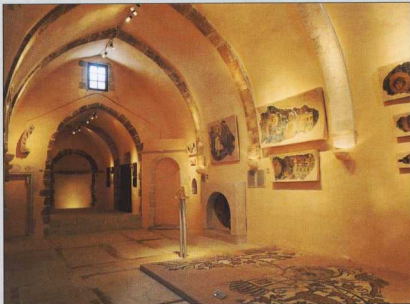
3. Άποψη του εσωτερικού. Νότιος τοίχος.