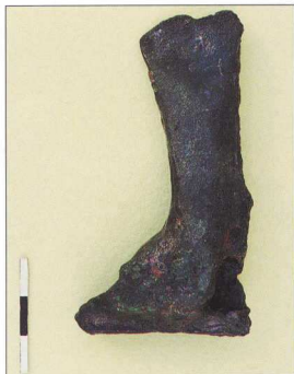
4. Χάλκινος πέλεκυς από το Αρχοντικό.