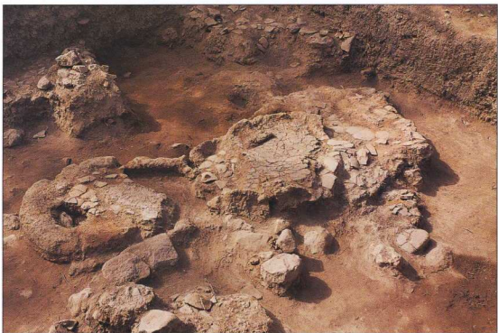
2. Κατασκευές στο εσωτερικό σπιτιού από το Αρχοντικό.

Ο μεγάλος αριθμός τους έδωσε την αφορ- μή να γίνει για πρώτη φορά μελέτη της πυροτε-