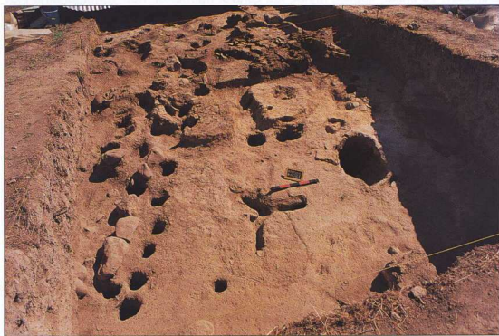
1. Λείψανα πασσαλόπηκτου σπιτιού από το Αρχοντικό Γιαννιτσών.

Το πιο ενδιαφέρον όμως εύρημα είναι ένας