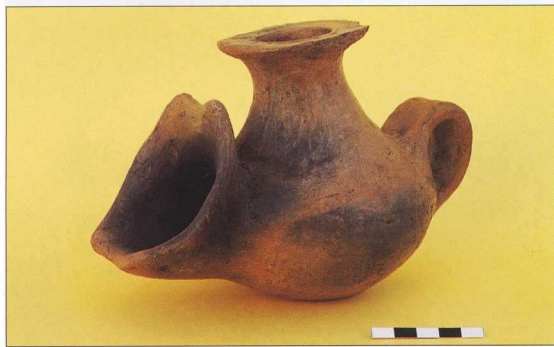
5, 6, 7. Χαρακτηριστικά αγγεία του Αρχοντικού.

Σε τρεις περιπτώσεις, δίπλα στους φούρνους αυτούς ήρθαν στο φως και ταφές μικρών παιδιών μέσα σε πιθάρι. Αποτελούν τα λιγιστά ίχνη της ιδεολογίας των κατοίκων του οικισμού μαζί με τα ολιγάριθμα επίσης ειδώλια και τα κοσμήματα που βρέθηκαν σκόρπια στα δάπεδα των σπιτιών. Θα πρέπει να σημειώσουμε ότι η ταφή νηπίων μέσα στα σπίτια δίπλα σε εστίες αποτελούσε συνήθεια από τη Νεολιθική εποχή.