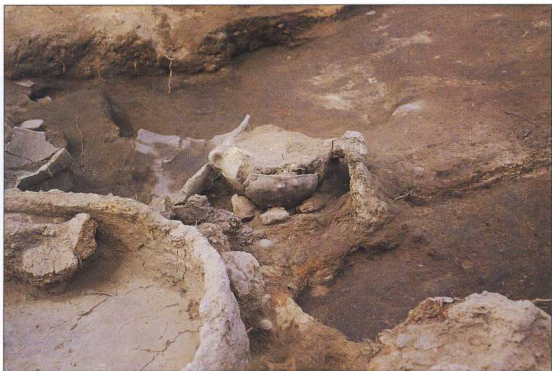
3. Λείψανα φούρνου με αγγείο στο εσωτερικό του από το Αρχοντικό.

μεγάλος αριθμός πήλινων κατασκευών –ανοιχτές εστίες, χαμηλές πλατφόρμες κ.λπ.–, που “πατούσαν” στα δάπεδα των σπιτιών και εξυπηρετούσαν καθημερινές ανάγκες, όπως φωτισμό, ζέσταμα, μαγειρέμα κ.λπ. Ο πιο συχνός τύπος είναι οι κατασκευές με ελλειψοειδές σχήμα, που θεωρήθηκαν μικροί φούρνοι με θολωτή στέγαση και με ένα μικρό πλευρικό άνοιγμα, όπως δείχνει μια κατασκευή που διατηρήθηκε σε σχετικά καλή κατάσταση (εικ. 8). Φαίνεται ότι το κα-