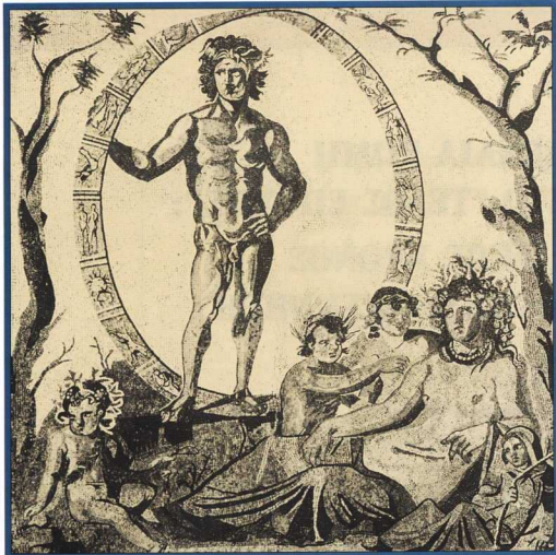
1. Ο Άγιος κρατάει τον κύκλο του ζωδίου. Κοντά του καθόνται η ρωμαϊκή θεότητα της γης, Τέλλους, και οι τρεις (από τις τέσσερις) εποχές. Μισοαίολο από το Μίθραο στην πόλη Σζίννο (στην κεντρική Ιταλία). Μόναχο. Γλυπτοθήκη, 3ος αι. π.μΧ.

Η πρώτη και εμφανέστερη πηγή είναι η φιλοσοφία των στωικών, της οποίας η επίδραση στη ρωμαϊκή σκέψη υπήρξε καταλυτική. Οι στωικοί πίστευαν ότι ο κόσμος, ως δομημένο, συγκροτημένο σύνολο (διακόσμησις), υπόκειται σε έναν περιοδικό ρυθμό καταστροφής, μέσω μιας διαδικασίας που σήμερα θα αποκαλούσαμε θερμικό θάνατο (έκπύρωσις), και στη συνέχεια αναγέννησης (παλιγγενεσία), με τελικό αποτέλεσμα την επάνοδο στην τάξη (ἀποκατάστασις). Οι παραπάνω όροι εμφανίζονται συχνά στα σωζόμενα αποσπάσματα του Ζήνωνα (335-263 π.Χ.) και του Χρυσίππου (περίπου 280-207 π.Χ.) 3 : η έκπύρωσις ( deflagratio ) 4 παίζει το ρόλο του καταλύτη που εξαφανίζει την περιοδική αναγέννηση του σύμπαντος. Το δυναμικό αυτό σχήμα ανάγεται με τη σειρά του σε ένα φάσμα ιδεών, οι οποίες καθόρισαν την ελληνική σκέψη πριν από τους στωικούς. Οι ιδέες αυτές ανα-