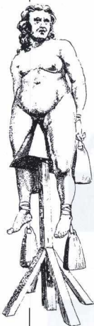
Συνθηματικό μέσο σφραγισμένο για μάγισσες: αποσκευασμένο στον ακρωτηριασμό των γεννητικών τους οργάνων. Από αυστριακό αρχείο: Βλ. Villeneuve, R., Le Musée des Supplices , Paris 1982.

λευκής και κακοήθους μαγείας –, ενώ οι θεωρητικοί όροι ανάλυσης (και κατηγορηματικής απόρριψης) της μαγείας και της «δεισιδαιμονίας» εν γένει γίνονταν ολόένα και περισσότερο συνειδητά θεολογικοί και ηθικοί: όλες οι εθνικές λατρευτικές πρακτικές χαρακτηρίζονταν συλλήβδην ως δαιμονικές και ανήθικες 7 . Οι Πατέρες της Εκκλησίας δεν είχαν εξάλλου κανένα λόγο να προχωρήσουν σε πιο λεπτολόγους διακρίσεις ανάμεσα στη θρησκεία και τη μαγεία των εθνικών.