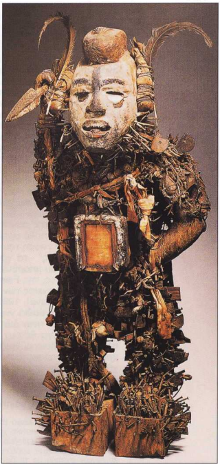
1. Αρχαιολογία και Τέχνες 71 (Απρίλιος-Μάιος-Ιούνιος 1999), 6 κ.ε.

Λατρευτικό (φυακτήριο) εδωμένο από ξύλο, κορδόνι, σίδερο και πανί. Ζαΐρ, πριν από το 1878: Ο ιερός αυτός κνηγός της φυλής των Κόγκο ηγάρει την κακοήγη μαγεία.