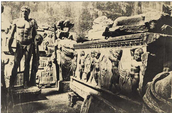
1. Άποψη του εσωτερικού του Θησαυρού γύρω στα 1870. Το Θησαύριο λειτούργησε ως αρχαιολογικό μουσείο από το 1834 ως το 1935.

Ο πρωταρχικός σκοπός των μουσείων ήταν η αποθήκευση και η ασφαλής φύλαξη των αρχαιοτήτων. Αυτό