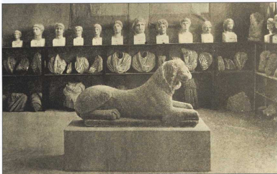
3. Έκθεση γλυπτών στο αρχαιολογικό μουσείο της Θήρας. (Gaerttringen, H. - Wiiski, P. 1904. Stadtgeschichte von Thera. Berlin.)

Ως προς τον εκθεσιακό εξοπλισμό , χρησιμοποιούνταν συνήθως ο ίδιος τύπος – απλούστερος στα μικρά μουσεία και πιο πολυτελής στα μεγάλα. Ο εξοπλισμός αυτός αρχικά περιελάμβανε απλές επιφάνειες, “ιδιοκατασκευές” ή επιφάνειες που ήταν ήδη διαθέσιμες. Η κατασκευή εξειδικευμένου μουσειακού εξοπλισμού ξεκί-