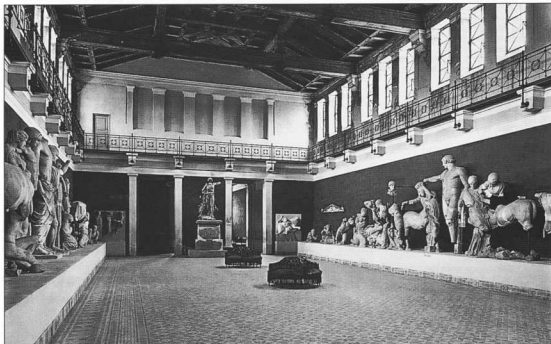
7. Αποψη της κεντρικής αίθουσας του παλιού αρχαιολογικού μουσείου της Ολυμπίας. Στο βόθος διακρίνεται η Νίκη του Παιονίου.

- Meltzer, D., 1981. "Ideology and Material Culture". Στο: Gould, R., and