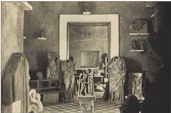
2. Αρχαιολογικό Μουσείο Σπάρτης. Αποψη του εσωτερικού στις αρχές του αιώνα. (Μεγάλη Ελληνική Εγκυκλοπαίδεια.)

Έως το 1909 είχαν ιδρυθεί σε όλη την επικράτεια 33 συνολικά 34 μουσεία (23 από την Αρχαιολογική Εταιρεία και 11 από το κράτος). Τα περισσότερα μουσεία είχαν ιδρυθεί σε αστικά κέντρα, ενώ αρκετά ήταν εκείνα που βρίσκονταν σε αρχαιολογικούς χώρους. Για τη στέγαση των μουσείων χρησιμοποιούνταν είτε υπάρχοντα δημόσια κτήρια είτε νέα κτήρια, ενώ σημαντικός υπήρξε και ο ρόλος ιδιωτών στη χρηματοδότηση μουσειακών κτηρίων. Η αρχιτεκτονική των μουσείων ήταν απλή. Η προτίμηση για τη νεοκλασική αρχιτεκτονική είναι σαφής, τίποτα όμως δε θυμίζει τις εντυπωσιακές προσόψεις και τον πολυτέλειο εσωτερικό διάκοσμο πολλών από τα ευρωπαϊκά μουσεία, που είχαν χτιστεί σύμφωνα με τα ιδεώδη της κλασικής ελληνικής αρχιτεκτονικής. Ακόμα και τα πιο "πολυτελή" ελληνικά μουσεία είχαν αρχιτεκτονικά απλές προσόψεις και εσωτερικό, και εύκολα "αναγνώσιμη" διαρρύθμιση. Η ίδια αρχή εφαρμοζόταν και στην εσωτερική διακόσμηση.