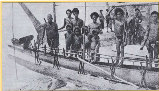
3. Μερική αποσυνομαρμόλωση και επίσκεψη κανώ στις Τροβανδούς Νήσους; ο ιδιοκτήτης, που είναι και ψαλμαρχος, και ο απαραίτητος μάγος διακρίνονται στα αριστερά (περίπου 1918).

συχνά διαπιστώνει ότι ένα Ξόρκι ή μια προσευχή δεν κάνει σχεδόν τίποτε περισσότερο από το να προσδιορίζει τη δραστηριότητα στην οποία χρησιμοποιείται και να ορίζει ένα κριτήριο για "επιτυχία" σ' αυτήν. "Τώρα φυτεύω αυτό το περιβόλι. Ας είναι τόσο καρποφόρο, που να μην μπορώ να το τρυγήσω ολόκληρο, Αμήν!". Ένα Ξόρκι αυτού του είδους δεν έχει νόημα από μόνο του και εκπληρώνει τον τεχνικό του ρόλο μόνο μέσα στο πλαίσιο ενός μαγικού συστήματος, στο οποίο η καθεμιά κηπουρική εργασία συνοδεύεται από παρόμοιο Ξόρκι, ώστε η συνολική ακολουθία Ξορκιών να αποτελεί ένα πλήρες γνωστικό σχέδιο "κηπουρικής".