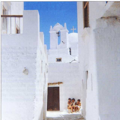
Πάρος: Χαρακτηριστικό δείγμα παραδοσιακού κυκλαδικού πολιτισμού.