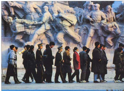
3. Επισκέπτες και προσκηντές στην Πλατεία Τιενανμέν, μπροστά στο μωσαϊκό του Μάο (περ. "Γυναικά", Ιανουάριος 1998).

Στα μέσα του 19ου αιώνα, το Campo Santo στη Νάπολη ήταν αποκλειστικά αφιερωμένο στους ενδείς και χωρίς οικογενειακούς νεκρούς. Ένας χαμηλός τοίχος περιέκλειε μια τετράγωνη περιοχή, διαιρεμένη σε 365 κρύπτες ή λάκκους, έναν για κάθε μέρα του χρόνου. Ο κάθε λάκκος