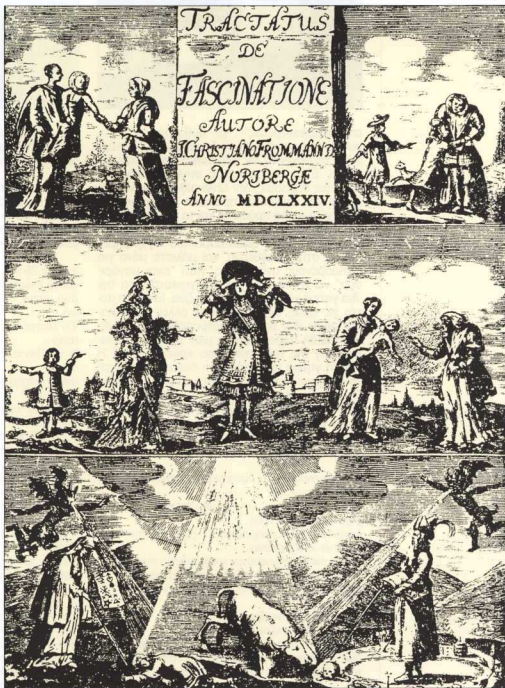
5. Το εξώφυλλο της "Πραγματείας περί ματιάσματος" του Christiano Frommann (1674), όπου απεικονίζονται διάφορες σκηνές ματιάσματος παιδιών κυρίως, αλλά και ενηλίκων ανθρώπων και ζώων.

Οι επώδες που εκφωνούνται για το ξεματίασμα είναι γητιές με το κυριολεκτικό νόημα της θεραπευτικής "γητιέας" που ασκούν. Είναι επιτελεστικά κείμενα, πράττουν ενώ λένουν και περιγράφουν ενώ πράττουν. Πρόκειται για λόγο "μαγικό", που διαθέτει όλα τα στοιχεία που χαρακτηρίζουν μια τελετουργία. Είναι λόγος ρυθμικός, απεικονιστικός και