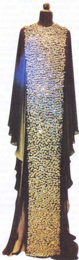
7. Για τα μάτια του κόσμου η δημιουργία της Μόνας Τούκλι.

Η τελική φάση είναι αυτή της επανένωσης. Τώρα ο λόγος μεταλλάσσεται κυριολεκτικά σε πράξη που τελείται πάνω στο ανθρώπινο σώμα. Οι δύο πρώτες γητείες τελειώνουν με αρίθμηση από το ένα ως τον ιερό αριθμό σαράντα, η πρώτη με εκμέτρηση σαράντα πιθαμών πάνω στο σώμα του ματιασμένου (πρώτα από τα πόδια ως το κεφάλι και μετά αντιστροφή) και η δεύτερη με εκμέτρηση των δώδεκα οπών του σώματος και με γλείψιμο του μετώπου του πάσχοντος 14 .