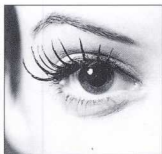
1. Το μάτι που ματιάζει είναι ασύμμετρο.

Φορέας αυτής της επίφοβης δύναμης είναι το μάτι, το όργανο της όρασης και της οπτικής επικοινωνίας. Η όραση είναι η πιο κοινωνική, η πιο πολύσημη και η πιο διεισδυτική αίσθηση. Το όργανό της, το μάτι, παρουσιάζει μία διαπολιτισμική εμβέλεια ως σύμβολο γνώσης και δύναμης. Το μάτι γνωρίζει επειδή βλέπει, και γι' αυτό έχει μία δύναμη κατοχής πάνω στα αντικείμενα που θεάται, μεταφέρει εμπειρίες και αισθήματα, είναι το ενδιάμεσο ανάμεσα στον άνθρωπο και τον κόσμο, κατέχει και ανακαλεί την αλήθεια πα-