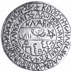
Φυλακτήριος σφραγίς. Βυζαντινών Μουσείων Αθηνών. Παλαιохριστιανική εποχή.

Ιδιαίτερα σημαντική για την ποινική αντιμετώπιση της μαγείας σε ολόκληρη την πρώτη περίοδο, που σφράγισσε όμως με τα επακόλουθα της όλη τη Βυζαντινή εποχή, υπήρξε μία διάταξη του Μ. Κωνσταντίνου, με την οποία καθιερώθηκε η διάκριση της μαγείας σε "καλή" και σε "κακή" — μία διάκριση που έχει επιβιώσει μέχρι τις μέρες μας, με άλλη όμως ορολογία. Σήμερα γίνεται λόγος για "λευκή" και για "μαύρη" μαγεία. Η διάκριση αυτή δεν ήταν βεβαίως επινοηση του Μ. Κωνσταντίνου, γιατί είναι γνωστό, ακόμη και από νομικές πηγές, ότι γινόταν χρήση μαγικών μέσων για την ίαση ασθενειών ή για την