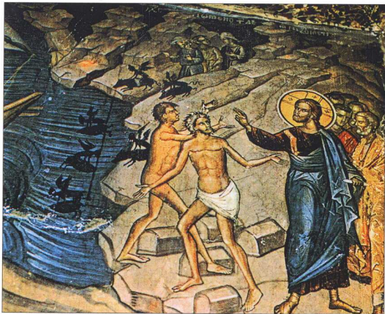
Ο Χριστός θεραπεύει τους δαιμονιζόμενους των Γεργεσηνών. Τοιχογραφία. Άγιος Νικόλαος Αναπαύσας, Μετέωρα Θεσσαλίας, 1527.

ματα περιλαμβάνονται πολύ περισσότερες διατάξεις κατά των μάγων από όσες έχει η "Εκλογή". Μέχρις ενός σημείου υφίσταται αντιστοιχία ανάμεσα στις διατάξεις των Ισαύρων και στις διατάξεις των Μακεδόνων. Στη διάταξη όμως που κατ'εξοχήν αφορά τους μάγους και τη συμπαρέχου του με τους δαίμονες, παρά το γεγονός ότι διατηρείται η αντικειμενική υπόσταση του εγκλήματος, όπως διαμορφώθηκε στην "Εκλογή", διαπιστώνουμε ως προς την υποκειμενική υπόσταση σημαντική καινοτομία: "Οι εις βλάβην ανθρώπων δαίμονες επικαλούμενοι, ει μη κατά άγνοιαν τούτου πράξωσι, ξίφει τιμωρείσθωσαν"). Η διατύπωση του κεμένου δεν αφήνει περιθώρια αμφιβολίας ως προς το ότι η άγνοια του δράστη δεν είναι λόγος μειώσεως της ποινής, αλλά λόγος που αποκλείει την τιμωρία εξαιτίας πραγματικής πλάνης.