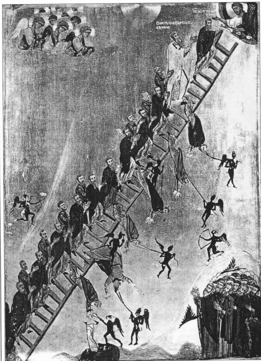
Η Ουρανοδρόμος Κλίμαξ, Φορητή εικόνα. Μονή του Σινά. 12ος αιών.

νό της ήταν, αν όχι οπωσδήποτε αληθινό, πάντως, με τα κριτήρια της εποχής εκείνης, αληθοφανές. Άλλωστε, όπως συνάγεται από πολύ παλαιότερες πηγές, φαίνεται ότι τέτοιου είδους μαγικές πρακτικές δεν ήταν ασυνήθιστες, ιδίως για την πρόβλεψη του μέλλοντος.