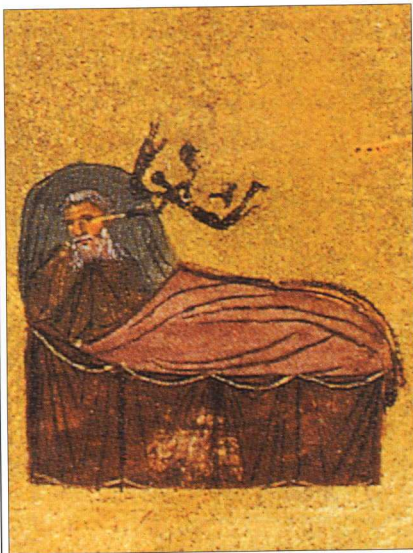
2. Δαίμονας επιτίθεται σε κοιμημένο μοναχό προκαλώντας του ύπνο που φέρνει δαιμονικά όνειρα. Λεπτομέρεια από τον Σιναϊτικό κώδικα 418, φιλ. 170 γ, που εικονογραφεί σχετικό χωρίο του Ιωάννου Σιναΐτου.

μένα και κοριοτροποποιημένα περιπτώματά του, τα οποία τοποθέτησε και μέσα στην κανδήλα, χρησιμοποιώντας τα ως προσωπική του θυσία προς τους δαίμονες. Με τις εξηγήσεις αυτές και με μια ανάλυση του τρόπου με τον οποίο μαθαίνουν οι μάγοι το παρελθόν, κλείνει το τόσο πλούσιο σε πληροφορίες αλλά και τόσο απεχθές επεισόδιο αυτό.