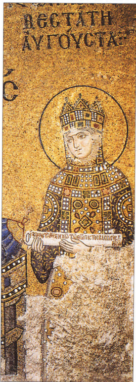
3. Η αυτοκράτειρα Ζωή η Προφυρογέννητη, από ψηφιδωτή παράσταση δεσφείας στην Αγία Σοφία Κωνσταντινουπόλεως (11ος αι.). Ήταν όντως μάγισσα.

ίδιο αποτέλεσμα: οι χριστιανικές εικόνες, έχασαν την θεία χάρη και προσείλκυσαν τους δαίμονες. Είναι χαρακτηριστικό πως ο Επιφάνιος, όταν παίρνει ο ίδιος τις βεβηλωμένες εικόνες γνωρίζει ότι θα στρέψει τους δαίμονες προς το μέρος του. Η υπόλοιπη τελετουργία – ανάμμα λυχναρίων και επικλήσεις μπροστά από τις μαγικές εικόνες, καθώς επίσης νηστεία και αγρυπνία –, όπως ακριβώς και εκείνη του Βιγρίνου, δεν προδίδει καθόλου την δαιμονική φύση της, προσφερόμενη στους μάγους κάλυψη αλλά και την δυνατότητα να εξαπατούν τους αφελείς πιστούς.