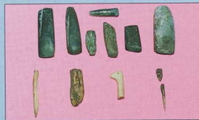
7, 8, 9. Επιφανειακά ευρήματα διαφόρων φάσεων από το εσωτερικό των σπηλαίων.