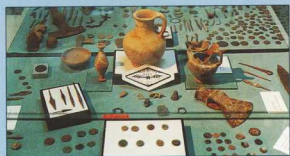
3. Η αρχαιολογική συλλογή του Μουσείου.

Τα περισσότερα όμως εκθέματα που παρουσιάζονται αφορούν στη σπηλαιολογική έρευνα και προέρχονται είτε από επιφανειακές είτε από ανασκαφικές έρευνες που διενήργησε το ΑΠΘ και άλλα ιδρύματα στις ιζηματογενείς πρωτογενείς εναποθέσεις του εσωτερικού χώρου των 15 σπηλαίων.