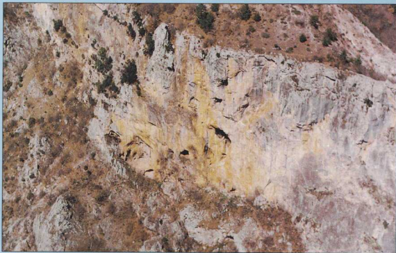
1. Μερική άποψη της καρστικής περιοχής στην οποία διακρίνονται οι εισοδοί των 15 σπηλαίων.