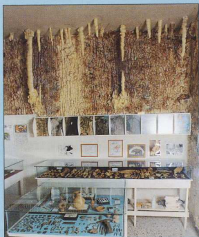
2. Άποψη από το εσωτερικό του σπηλαιολογικού Μουσείου: αναπαράσταση σπηλαίου.