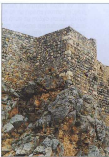
8. Ορθογώνιοι πύργοι στη νότια πλευρά του Κάστρου.

Το σωζόμενο σήμερα Κάστρο προέρχεται από την περίοδο της ιπποτοκρατίας (1309-1523) 28 . Η ανάβαση σ' αυτό γίνεται από 230 χτιστά σκαλοπάτια (εικ. 7), που έχουν κατασκευαστεί το 1984 από τον λαϊ-