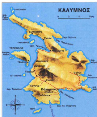
1. Γεωφυσικός χάρτης Κάλυμνου. Φραγκόπουλος 1995.