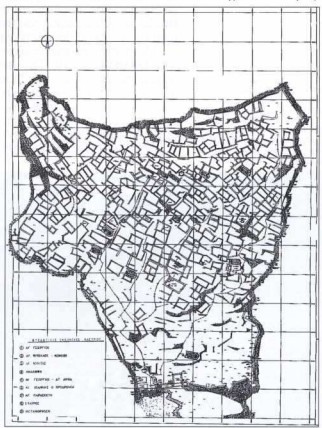
9. Τοπογραφικό του Μεγάλου Κάστρου της Χώρας Καλύμνου (αρχείο 4ης ΕΒΑ Δυδικανήσου).