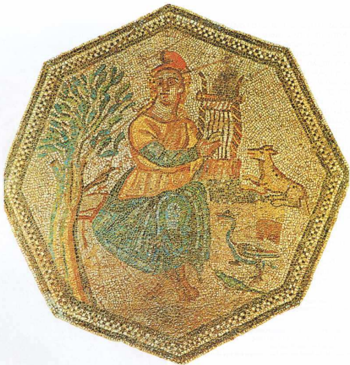
2. Ο Ορφέας εξημερώνει το άγριο ζώο με τη μουσική. Ψηφιδωτό από την "Οικία του Μεγάνδρου" στη Μυτιλήνη, 3ος αι. μ.Χ. (Ιστορία του Ελληνικού Έθνους, τ. Ε', Εκδοτική Αθηνών, 1974.)

σωστές οι ταυτίσεις των νεολιθικών στεατοπηγικών γυναικείων ειδωλίων με θεές της γονιμότητας που συνδέεται με την αγροτική παραγωγή. Η αντίληψη ότι άνθρωπος, ζώα και φυτά μετέχουν ισότιμα στο σύνολο της φύσης, που έχει θεϊκή υπόσταση, αρχίζει να υποχωρεί. Ο άνθρωπος αρχίζει να ξεχωρίζει τον εαυτό του από τη φύση, πράγμα που αποτελεί και την απαρχή μιας ουσιαστικής μεταβολής της αντίληψης για τη φύση και το δάσος.