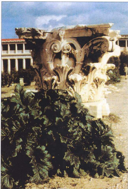
1. Κορινθιακό κιονόκρανο έμπλα στο φυτό Acanthus mollis (άνανθος ή απάλη). Τα φύλλα αυτού του φυτού αποτέλεσαν πηγή έμπνευσης για τον γλύπτη, (Φωτ. Ελληνική Φύση.)

Από τις σπάνιες, και γι'αυτό πολύτιμες, πηγές μας για τον πνευματικό βίο των προϊστορικών ανθρώπων είναι οι βραχογραφίες των σπηλαίων. Γνωστές είναι οι τοιχογραφίες και οι βραχογραφίες στα σπήλαια του Λασκάυ στη Γαλλία και της Αλταμίρας στην Ισπανία. Τα θέματα των παραστάσεων είναι κυρίως ζώα και σκηνές κυνηγιού. Ενδιαφέρουσα, για το θέμα που εξετάζουμε εδώ, είναι η ερμηνεία που έχει δοθεί, ότι οι παραστάσεις αυτές είναι μαγικές. Η θανάτωση των ζώων πρέπει να καθαγιαστεί διαμέσου των απεικονισμών αυτών, επειδή ο άνθρωπος αντιλαμβάνεται ότι σκοτώνει όντα που είναι της ίδιας ιερής φύσης που χαρακτηρίζει και τον ίδιο. Πιο κάτω θα αναφερθούν παραδείγματα επιβίωσης των αντιλήψεων αυτών κατά τους ιστορικούς χρόνους και κατά τη σύγχρονη εποχή.