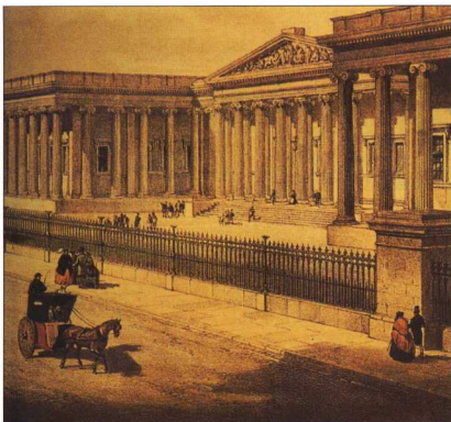
2. Το Βρετανικό Μουσείο γύρω στα 1860. (Από Caygill, 1981.)

μας ενδιαφέρει είναι ότι, από τη στιγμή που σχηματίζεται μια συλλογή, ο κάτοχος της διακατέχεται από την επιθυμία να τη δείξει και σε άλλους ανθρώπους, επιζητώντας το θαυμασμό, την έγκριση ή την κοινωνική καταξίωση. Εδώ ακριβώς βρίσκεται και η αρχή της δημιουργίας των μουσείων.