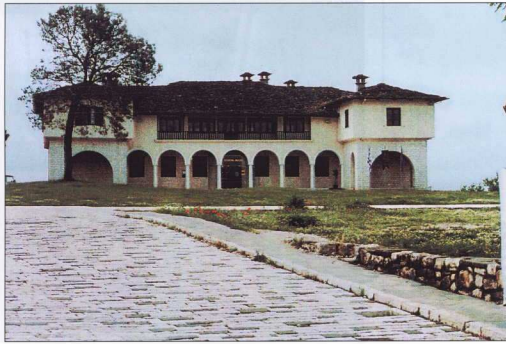
6. Βυζαντινό Μουσείο Ιωαννίνων.

Στα πρώιμα αθηναϊκά μουσεία συγκαταλέγονται και εκείνα της εν Αθηνάς Αρχαιολογικής Εταιρείας, ένας από τους βασικούς σκοπούς της οποίας ήταν η φύλαξη των αρχαιοτήτων έως ότου ιδρυθεί Εθνικό Μουσείο στη χώρα. Η συλλογή της Εταιρείας στεγάστηκε διαδοχικά στο Πανεπιστήμιο (1858-65), στο Βαρβάκειο Λύκειο (1862-82) και στο Πολυτεχνείο (1877-93) 31 .