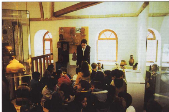
8. Εκπαιδευτικό πρόγραμμα στο τζαμί Τζουρτζακή.

Ανατρέχοντας στις εξελίξεις της τελευταίας εικοσαετίας, περίπου, θα μπορούσαμε να συνοψίσουμε τις τάσεις που επικρατούν στο χώρο