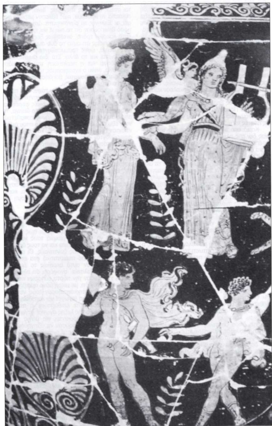
2. Αγγειογραφία: Ο Ορφέας οδηγεί την Ευρυδική μέσα στον Άδη. Έργο του Ζωγράφου του Άδη, 330 π.Χ. Νάπολη, Museo Archeologico Nazionale.