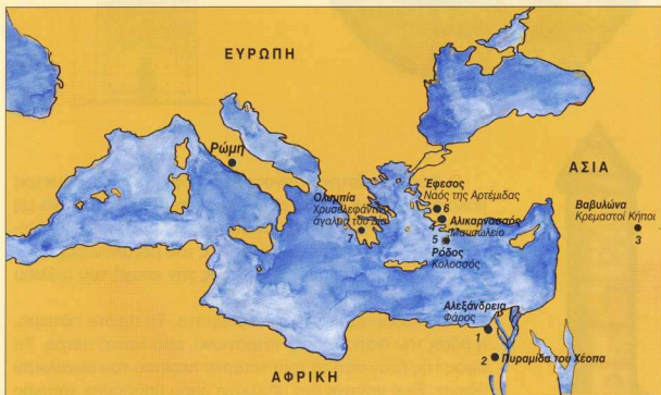
Χάρτης της Μεσογείου, όπου σημειώνονται τα επτά θαύματα του κόσμου.

Μπορείς να ξεκινήσεις από την πρωτεύουσα της αυτοκρατορίας, τη Ρώμη. Θα πάρεις ένα πλοίο από την Όστια, το λιμάνι που βρίσκεται κοντά, για την Αλεξάνδρεια, στην Αίγυπτο.