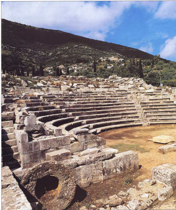
2. Θέατρο Μεσσήνης: Το θέατρο διατήρησε την αρχική του μορφή με την πρώτη σειρά εδωκίων στην περιφέρεια της ορχήστρας.

ύποθεση ήταν να έχουν ετήσιο οικογενειακό εισόδημα τουλάχιστον 2.000 αττικών δρχ. Σταδιακά, επικράτησε η αγορά του δικαιώματος αυτού, μαζί με εκείνο του Αθηναίου πολίτη, από γιους πλούσιων "μετοίκων" (2ος π.Χ. αιώνας) 4 . Η έλλειψη εξωτερικού κινδύνου και η απροθυμία της Ρώμης να επιτρέψει τη δημιουργία τοπικών στρατών (για ευνόητους λόγους) οδήγησαν στην απογύμνωση του θεσμού της εφη-