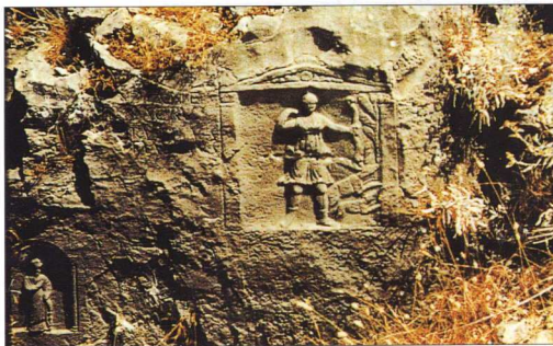
2. Η Θεά Άρτεμις κυριαρχεί στα σκαλισμάτα των βράχων.