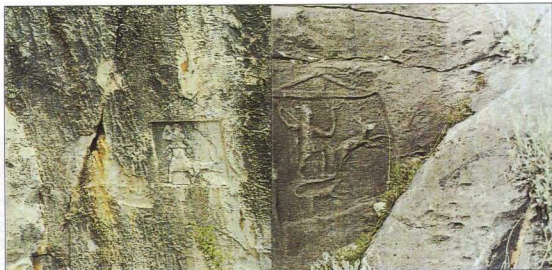
4. α, β. Σε μια σειρά από βραχοναγίλματα εμφανίζεται η Άρτεμις έτοιμη να θυσιάσει το προστατευόμενο ζώο της.

θιστες αλλά και ενδιαφέρουσες. Αυτές μπορεί να είναι αναθηματικά αφιερώματα, καμωμένα προς τιμήν ενός θεού ή μιας λατρείας, ή ως μέρος τελετής στη μνήμη νεκρών προσώπων.