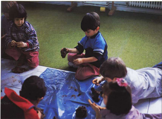
2. Ελεύθερος πειραματισμός με τον πηλό.