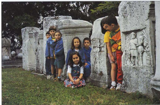
1. Παιχνίδι στον κήπο του Μουσείου.

ποιούν μεθόδους προσέγγισης έχοντας ως γνώμονα τα ιδιαίτερα χαρακτηριστικά της παιδικής ηλικίας. Σκοπός των προγραμμάτων αυτών είναι να εξελιχθούν τα μουσεία σε χώρους παιδείας, μορφωτικών και ψυχαγωγικών δραστηριοτήτων. Με τα προγράμματα αυτά τα παιδιά ελκύονται σε ενεργητική συμμετοχή στην έρευνα με-