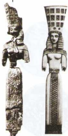
Ξύλινο αγαλμάτιο της Ήρας με "πυλέωνα", από το Ηραίο II της Σάμου. 650-630 π.Χ. Βοθύ, Μουσείο.

Στους ολυμπιακούς αγώνες της Κλασικής εποχής, οι οποίοι έλκουν την καταγωγή τους από τα Ηραία (Weniger 1905, 30; Kerényi 1972, 108; Drees 1962, 120), η συμμετοχή υπάνδρων γυναικών ήταν αυστηρά απαγορευμένη. Οι παρθένες, αντίθετα, οι νεαρές έφηβες, είχαν το δικαίωμα να τους παρακολουθήσουν από κοντά. Μοναδική εξαίρεση συμμετοχής παντρεμένης γυναικας αποτελούσε η ιερεία της Δημήτρας Χαμύνης (Πaus. 6, 20, 9), η οποία παρακολουθούσε τους αγώνες από περίοπτη θέση, καθισμένη σε βωμό που ήταν τοποθετημένος απέναντι ακριβώς από την επιτροπή των ελλανοδικών. Από τον υποδειγματικό χαρακτήρα της μοναδικής αυτής εξαίρεσης διαφαίνεται πως αρχικά η λειτουργία των ενήλικων γυναικών πρέπει να ήταν σημαντική. Πράγματι οι έμπειρες υπάνδρες γυναικας, οι ίδιες που στη διάρκεια της μυσής αναλαμβάνουν την ευθύνη της διδασκαλίας των κοριτσιών σε σχέση με τις υποχρεώσεις και τα καθήκοντα που θ' αντιμετώπιζον στον έγγαμο