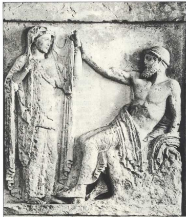
3. Μετόπη του ναού της Ήρας (Ναός Ε) στον Σελινόντιο, Σάχη "ιερού γάμου" του Διός και της Ήρας. Η χειρονομία "χείρ έπι καρπού" συμβολίζει, μέχρι και την ύστερη αρχαιότητα, το δεσμό του γάμου, 46 π.Χ. Παλέρμιο, Museo Nationale.