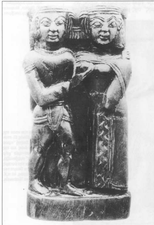
5. Ξύλινο ανάγλυφο "ανατολιζόντας" ρυθμού από το Ηραίο II της Σάμου, που έχει, δυστυχώς, χαθεί. Ερωτική σκηνή ανάμεσα στον Δία (που κρατάει εγκλωσμένη την Ήρα απ' τους ώμους) αδρανώντας συγχρόνως το στήθος της) και την Ήρα. Γύρω στα 610 π.Χ.

παρά το γεγονός ότι ο ίδιος δεν εμφανίζεται ποθεν: η λατρεία τους δηλαδή δεν είναι κοινή και η Ήρα λατρεύεται μόνη της (εικ. 3). Αν και τα θεογάμια, ο ιερός γάμος των θεών, χαρακτηρίζουν και άλλα θεϊκά ζεύγη (Κόρη-Πλούτων, Δημήτρα-Ιασιών, Διώνυσος-Αριάδνη, Αφροδίτη κ.ά.), η "θηϊκή" σημασία που διαπνέει τον ιερό γάμο Ήρας-Διός είναι μοναδική 2 . Και αυτό επειδή η Ήρα καταφύσκει μεν την ερωτική ηδονή, αλλά μόνο υπό την προϋπόθεση ότι πραγματοποιείται με τον ίδιο πάντα ερωτικό σύντροφο – άρχεται πριν ή μετά το γάμο: είναι το σημείο στο οποίο διαφοροποιείται από την επίσης προσταίδα του γάμου Αφροδίτη, της οποίας όμως η επιρροή αφορά τον ερωτισμό και τη γεννησια ορμή και δεν περιορίζεται στα όρια μιας αποκλειστικά μονογαμικής σχέσης.