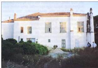
5. Αίγυα. Σπίτι Τρικούπης.

Από το τέλος του 19ου αιώνα μέχρι το 1940 η τοπική μνήμη διατηρεί ζωνήρα την ονομασία του σπιτιού ως "οικία Τρικούπης", και συγκεκριμένα απήχηση της συναντάμε στον τοπικό Τύπο, ως απλή αναφορά, ή σε ειδικά άρθρα με μινεία παλαιών κτιρίων του Αργούς 44 . Είναι χαρακτηριστικό ότι με τις ανακατατάξεις του Β' Παγκοσμίου πολέμου και του Εμφυλίου η ονομασία αυτή εξαφανίζεται και το σπίτι αποκτά το κατασκευασμένο όνομα των τελευταίων ιδιοκτητών ("σπίτι του Κωλέττη"), ενώ οι επίζυξες