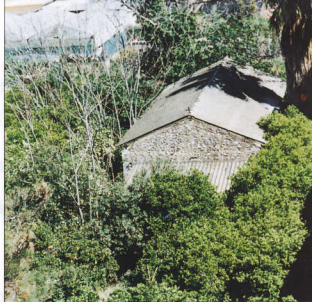
2. Τμήμα του κήπου σε άγρια κατάσταση και άποψη του παρεκκλησίου του Αγίου Χαράλαμους από βύθια. Τα πεύκα ξεραίνονται από επιδρομή κάμπας.

Μετά την κηδεία του Χαρ. Τρικούπης, και στο αμέσως επόμενο φύλλο της ίδιας εφημερίδας 42 , ο Βαρδουνιώτης επανέρχεται στο ίδιο θέμα με μικρό σημείωμα του, όπου καταγράφει άλλη πληροφορία, σύμφωνα με την οποία ο Σπ. Τρικούπης, μετά τη βάπτιση του γιου του, οικοδόμησε στο ανατολικό άκρο του κήπου του σπιτιού του μικρό ναό, με το όνομα εκείνου και για να τιμήσει τη μνήμη του Αγ. Χαράλαμους. Το εκκλησάκι αυτό διατηρείται μέχρι σήμερα, και στο σχέδιο πόλης του 1831 διακρίνεται σημείο που υποδεικνύει τη θέση του. Στο μεθεπόμενο φύλλο της εφημερίδας 43 ο Βαρδουνιώτης επανέρχεται και πάλι, παραθέτοντας άλλη μαρτυρία, του πρώην βουλευτή Αργούς Ιω. Ζωγράφου, που τότε βρισκόταν στο Μεσολόγγι, ο οποίος είχε προτείνει στον Χαρ. Τρικούπη να θέσει υποψηφιότητα βουλευτή στο Αργος, στη θέση του ίδιου και πριν από τις "μοιραίες" εκλογές. Ο Ζωγράφος έγραφε πως ο Τρικούπης του απάντησε κατά λέξη ότι δικαίωμα να θέσει υποψηφιότητα δεν είχε λόγω εγκαταστάσεως, είχε όμως λόγω γεννήσεως, αφού το Αργος θεωρείται ως τόπος της γέννησής του, βεβαιώνοντας ότι ο πατέρας του έκτισε σπίτι εκεί, που συνέχιζε να αποκαλείται "οικία Τρικούπης". Στη συνέχεια, όμως, είπε ότι η οικογένειά του κατέφυγε στο Ναύπλιο για λόγους ασφαλείας, ότι εκεί γεννήθηκε και ότι η οικογένειά του επανέκαμψε στο Αργος και παρέμεινε εκεί, "της τάξεως αποκαταστάσης". Αντιφατικές μαρτυρίες, από τις οποίες η πρώτη έχει το πλεονεκτήματα ότι εκφέρεται από αυτόπτη και παρόντα μάτρυρα.