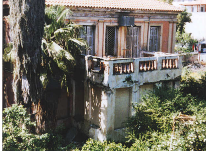
1. Απρίλιος 1998: Η οικία Τρικούπης από ανατολικά. Έχει γίνει επιδρόμωση της στέγης και σφραγισθούν τ' ανοίγματα του ισόγειου.