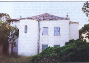
6. Αίγινα. Σπίτι Τρικούπη.