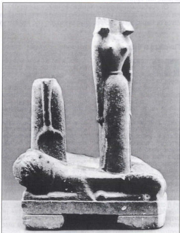
2. Περιρραντήριο από τη Σάμο.

μύθους τους. Ακόμα και τις λογοτεχνικές πηγές από την Αρχαία Ελλάδα της πρώτης χιλιετίας π.Χ. τις καλύπτει η προσπάθεια να παρουσιασθεί με ενιαία μορφή ο κόσμος των θεών του Ολύμπου, μια προσπάθεια που πολύ σπάνια μας επιτρέπει να ριξουμε μια αόριστη ματιά στη μυθική σκέψη του παρελθόντος. Για το λόγο αυτό, είναι πολύ δύσκολο να προχωρήσουμε, πέρα από τις περιγραφές και την τυπολογία των απεικονίσεων, σε κάποια συμπεράσματα για τη θρησκεία. Το μόνο που μπορούμε να κάνουμε είναι να ταξινομήσουμε την αρχαία κληρονομιά και να ερμηνεύσουμε το κάθε αντικείμενο ξεχωριστά, στο πλαίσιο της συχνότητας και των συνθηκών ανεύρεσής του. Πολύ γρήγορα θα διαπιστώσουμε όμως ότι γνωρίζουμε μόνο τελετουργικά σκεύη, δηλαδή διάφορα εξαρτήματα που έπαιζαν κάποιο ρόλο στις ιεροπραξίες. Είναι σχετικά σπάνης η χρήση ενός ρυτού ή ενός ζωόμορφου αγγείου. Στα δαχτυλίδια αυτά τοποθετείται κάποιο υγρό, το οποίο χύνουν σ'ένα