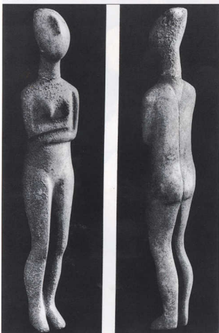
9. Μαρμάρινο ειδώλιο από την Αργόρα.

πανομοιότυπων απεικονίσεων της θεάς τόσο μέσα στον οικισμό όσο και στους τάφους στηρίζει αυτή την ερμηνεία. Ασαφής όμως εξακολουθεί να είναι η σχέση της θεάς με τα λιγοστά ανδρικά ομοιώματα, και δεν μπορούμε να απαντήσουμε στο ερώτημα αν ο λυράρης και ο αυλιτής μπορούν να ενταχθούν στο ίδιο πλαίσιο.