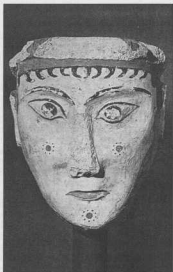
21. Πήλινο είδωλο από τη Φυλακωπή.