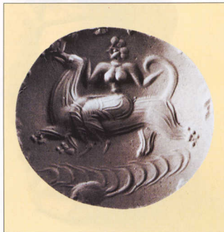
6. Σφραγίσμα από τη Μυκίνες.