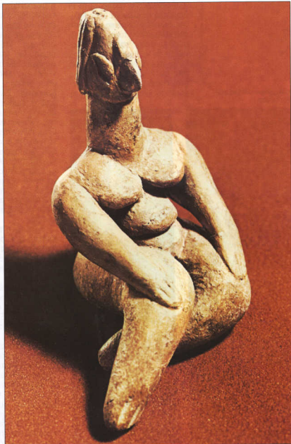
8. Πήλινο ειδώλιο από το Βόλο.

Στις Κυκλάδες συναντάμε, κατά την Πρώιμη Εποχή του Χαλκού, μόνο τον τύπο των όρθιων ειδωλίων. Τις μαρμαρίνες μορφές των κλασικών τύπων χαρακτηρίζει μια μικρή αλλαγή στη στάση των χεριών: οι δύο βραχίονες, σταυρωμένοι κάτω από το στήθος, ακουμπούν σφικτά στο σώμα (εικ. 9). Οι παχουλές μορφές των πρώιμων ειδωλίων αντικαθίστανται από έναν ενιαίο τύπο μορφής. Αυτό όμως δεν αλλάζει τίποτα