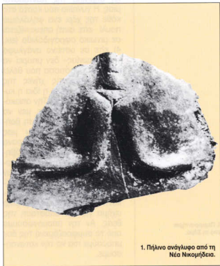
1. Πήλινο ανάγλυφο από τη Νέα Νικομήδεια.

Είναι δυνατόν όμως να ισχυριστούμε ότι γίνονταν με τον ίδιο τρόπο κατανοητές και στην Εποχή του Χαλκού όλες οι παραστάσεις, στις οποίες