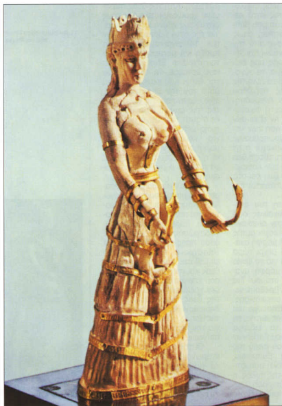
14. Ελεφάντινο ειδώλιο: Βοστώνη.

δεν μας παραπέμπει πειστικά ούτε στη θεά ούτε στην αναβαθμισμένη θέση των γυναικών. Εκτός αν υποθέσουμε ότι οι επεμβάσεις στην απεικόνιση της θεάς είχαν προχωρήσει ένα ακόμα βήμα ώστε να τοποθετηθούν θεατρικά μια ιέρεια στο θρόνο της Κνωσού – μια θεατρική αναπαράσταση του μύθου ως επικύρωση της τάξης πραγμάτων που έχει επιβληθεί. Η σύνθεση με τους γρόπιες ένθεν και ένθεν της θεάς θα ήταν τότε μια σκηνοθετημένη εικόνα που θα αντιστοιχούσε στις αντιλήψεις εκείνης της εποχής.