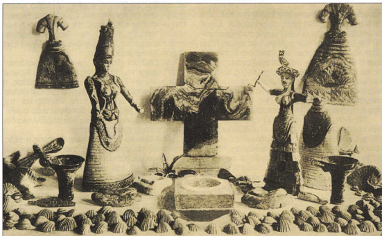
13. Πήλινα ειδώλια από την Κνωσό.