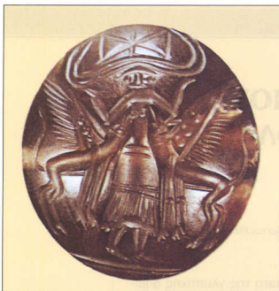
3. Σφραγιδόλιθος από την Κνωσό.

εμείς αναγνωρίζουμε το μη καθημερινό, και συνακόλουθα την έκφραση ενός θεϊκού περιεχομένου: Μήπως είναι εξίσου πιθανό, ό,τι σήμερα θεωρούμε ως πραγματικό ή μη πραγματικό να μην αποτελούσε τόσο ισχυρή αντίθεση στον πρώιμο αυτό κόσμο των εικόνων;