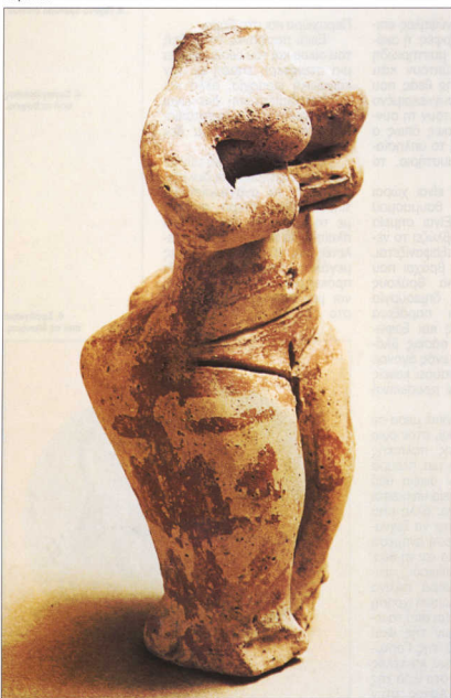
7. Πήλινο είδωλο από τη Χαϊρώντα.

Ακόμα, αξιωματικώς είναι ερωτήματα που ίσως εκ πρώτης όψεως να φαίνονται σχολαστικά. Έχει άραγε σημασία για την αξιολόγηση, αν η απεικόνιση είναι επίπεδη ή γλυπτή, αν είναι στατική, ή αν, αντίθετα, εσωκλείει κίνηση; Στις γλυπτές και στατικές παραστάσεις αποδίδεται περισσότερη εξουσία και επιβλητικότητα, μεγαλύτερη εγγύτητα στη θεά. Οι απεικονίσεις δράσης, τόσο στη γλυπτική όσο και στη ζωγραφική, προκαλούν συνεχώς συζητήσεις και διαφωνίες για τη σημασιολογία των υπόλοιπων μορφών που πλαισιώνουν τη θεά. Είναι άραγε η θεά τόσο απτά παρούσα, ώστε να μπορεί να εμφανίζεται μαζί με τους υπόλοιπους στην ίδια εικόνα; Μήπως χάρη στην παρουσία της ανυψώνονται οι άλλες μορφές σε κάτι το ανώτερο, μήπως γίνονται δηλαδή ιερείς και ιέρειες της; Υπάρχει όμως και η εκδοχή ότι σε κάθε εικόνα μπορούν οι άνθρωποι να στέκονται δίπλα στη θεά επειδή πρόκειται μόνο για την εμφάνιση ενός μύθου. Και εδώ οι γνώμες διαίτανται.