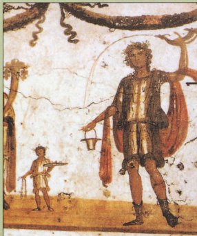
3. Οι μπότες αυτές έχουν "κορδόνα", όπως και οι δικές μας σήμερα.