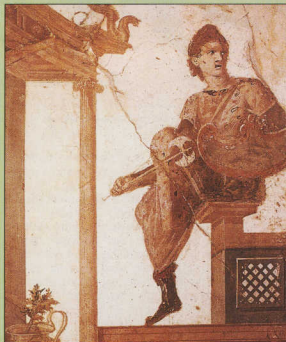
1. Πομπηϊνή τοιχογραφία. Αμαζόνα που φορεί μπότες. Έχουν, προφανώς, γούνη επένδυση. Οι Αμάζονες ήταν πολεμήτριες, αλλά τα υποδήματά τους ήταν ελαφρότερα από τα ανδρικά.