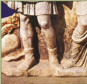
5. Εδώ βλέπουμε χαμηλές μπότες (από γάλαμα του Νέρωνα), που δένουν γύρω από το πόδι με ιμάντες.

ειδή 2 και κομψότερες από τις αντρικές, φορούσαν και οι γυναίκες.