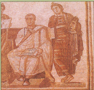
4. Η Μελομένη, Μούσα της τραγωδίας φορεί κρηπίδες.