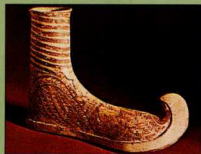
Μυκηναϊκό πήλινο ομοίωμα υποδήματος με γυρισμένη μύτη που μοιάζει με τις τυρρηκικές μπότες.

Η μπότα θεωρείται εξέλιξη του μονοδέματος , μεγάλου κομματιού δέρματος που περικάλυπτε το πόδι ως τον αστράγαλο ή λίγο πιο πάνω και το οποίο δενόταν με πέτσινα λουριά. Τέτοια θα ήταν τα πρώτα κλειστά “υπόδημα” της Νεολιθικής εποχής 2 .