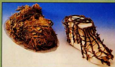
Νεολιθικός άνθρωπος των πόντων. Βρέθηκε στις Άλπεις “κατεψυγμένος”, με όλα του τα ρούχα.