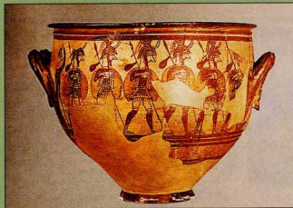
Κρατήρας των πολεμιστών.

Εξέλιξη του πρωτόγονου μονοδέρματος είναι οι καρβάνινα, είδος χαμηλής μπότας από ακατέργαστο δέρμα βοδιού, που φορούσαν οι χωρικοί. Στον Ξενοφώντα ( Κύρου Ανάβασις , 4.5.14) διαβάζουμε: "καρβάνινα πεποιημένα εκ τών νεοδάρτων βωών". Η φράση του Ηοϊόδου (V. 541-2): "ἀμφί δέ ποσσί πέδιλα βοός ἴρι κταμένοιο, ἄρμε δῆσασθαι, πῖλοις ἐντοσθε πυκάσσας" (ὅπως προαναφέραμε, ο ὅρος πέδιλον δηλώνει, γενικά, το υπόδημα) = αφού θανατώσεις βόδι, να φτιάξεις με το δέρμα του υποδήματα, ράβοντας στο μέσα μέρος τους μάλλινη (ή τρίχινη) επένδυση, μάλλον υπονοεί υποδήματα που μοιάζουν με τα λεγόμενα "γουρουντσάρουχα", τα οποία φοριόταν στην Ελλάδα ακόμη και στον δικό μας αιώνα.