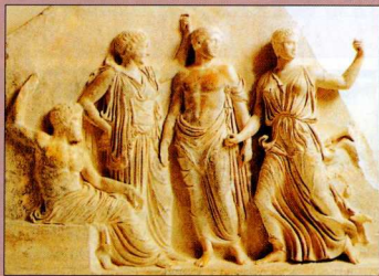
3. Η θεϊκή οικογένεια: Δίας, Λητώ, Απόλλων και Άρτεμις.

Στην αίθουσα των γλυπτών στέκονται τα αγάλματα των παιδιών με τα τρυφερά και εκφραστικά πρόσωπα καθώς και τα αναθηματικά ανάγλυφα με σκηνές από τη λατρεία και τις ιδιότητες της θεάς, όπως τις απεικόνισε ο καλλιτέ-