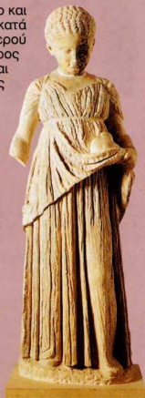
2. Αγαλμάτιο, ίσως Άρκτου (μικρού κοριτσιού, Δηλαδή), που υπηρετούσε τη θεά.

Σ την πρώτη αίθουσα βρίσκονται έργα κεραμικής μικροτεχνίας και κοσμήματα – αναθήματα των πιστών. Ανάμεσά τους διακρίνονται θραύσματα αγγείων μεγάλων ζωγράφων του 5ου αι. π.Χ., με παραστάσεις από τη θρησκευτική και την καθημερινή ζωή της εποχής. Ξεχωρίζουν τα επίνητρα, που βοηθούσαν τις γυναίκες στο γνέσιμο, οι οστέινοι αυλαί, οι σφραγιδόλιθοι, τα αλαβάστρινα αγγεία, οι μπρούντζινοι καθρέφτες και τα κοσμήματα. Επίσης οι χαρακτηριστικοί κρατηρίσιοι, στους οποίους απεικονίζονταν σκηνές σχετικές με τα δρώμενα κατά τη γιορτή των Βραυρωνίων.