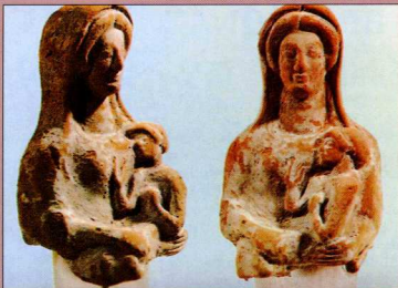
4. Ειδώλια κουροτρόφων που φανερώνουν την ιδιότητα της Αρτέμιδος ως προστάτιδος των παιδιών.