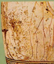
Δύο είδη σανδάλιων.