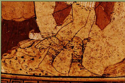
Φτερωτά σανδάλια του Ερμή.