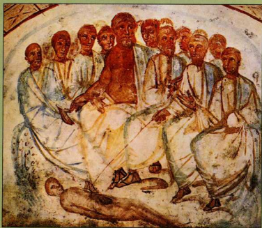
Παλαοχριστιανική τοιχογραφία στην κατακόμβη της Via Latina, όπου εικονίζονται ο Αριστοτέλης και οι μαθητές του να φορούν σανδάλια.

Λόγω των διαφορετικών κλιματολογικών συνθη-