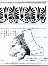
Αναπαράσταση της υψώσεως της στήλης σε σχήμα λεοντοκεφαλής. Στιem de Jong.

Ένας άλλος μύθος, που σχετίζεται με την Παλλήνη, αναφέρεται στην ιστορία του Ερχιθόωνιου, γιου της Γης. Ο Ηραστής θέλησε να κάνει παιδί με την Αθηνά (χωρίς να θέλει και εκείνη), με αποτέλεσμα η θεά να ριζεί το σπέρμα του στη γη. Έτσι γεννήθηκε ο Ερχιθόων, που η Αθηνά, κλεισμένος σε καλάθι, τον εμπιστεύθηκε στη τρεις κόρες του βασιλιά της Αθήνας, την Έρση, την Άγλαυρο και την Πάνδροσο, με την εντολή να μην το ανοίξουν. Η θεά πήγε στην Παλλήνη για να βρει βράχο κατάλληλον να χρησθαλισσει για αντέγερμα του ιερού της λάρου. Στην επιστροφή της, μια κουρούνα της αποκάλυψε πως αι κόρες του Κέκροπα άνοιξαν από περιέργεια το καλάθι. Η Αθηνά, έραλλη από θυμό, άφησε να πέσει από τα χέρια της ο βράχος που κουβαλούσε και που έγινε λάρος που ονομάστηκε "Λυκαβηττός" 17 . Η μετάβαση της Αθηνάς στην Παλλήνη αποδεικνύει τη σύνδεση της θεάς με τον χώρο αυτό από τα πολύ παλιά χρόνια, μπορεί μάλιστα, όπως υποστηρίζουν μερικοί, η λατρεία της να είχε ξεκινήσει από εδώ. Ακόμη όμως και να μην αληθεύει αυτό απόλυτα, η λατρεία της θεάς στο χώρο πρέπει να είναι πολύ παλιά, όπως συμπεραίνουμε και από τα πτηνομορφα ειδώλια που βρίσκονται στην επίχωση των θεμελίων του κλασικού ναού και προέρ-