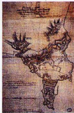
Archivio di Stato, Venezia. Provveditori alle Fortezze, dis. Diego a inchiostro, acquerellato su carta. 704 x 504 mm

κατείχαν τις χαμηλές διοικητικές θέσεις. Συχνά τους συναντάμε στο CD-ROM "Η Βενετία και η Θάλασσα" να συζητούν τις δυσκολίες στην παροχή νερού ή δημοκρατικών, ή να προσπαθούν να επιλύσουν τις διαμάχες μεταξύ των Ρωμαιοκαθολικών και των Ορθόδοξων κληρικών. Δεν ξέρουμε σχεδόν τίποτα γι' αυτούς -έχουν σωθεί κάποιες επιστολές προς τις αρχές της πρωτεύουσας και ελάχιστα οικογενειακά ιστορικά-, αλλά τα κοινά τους βιώματα μια επιτρέπουν να αντιληφθούμε τις πραγματικές διαστάσεις ενός βασικού θέματος αυτού του CD-ROM: της σημασίας των ορίων στην ιστορία του βενετικού πολιτισμού. Έχοντας αναλύσει την περιοχή των συνόρων μεταξύ της Ανατολής και της Δύσης, μεταξύ της βενετικής δύναμης και της τουρκικής απειλής, ανακαλύψαμε ότι ακόμα και τα πολιτιστικά όρια των κατοίκων της ήταν αβέβαιο και αμφίβολο. Σ' αυτήν τη μεταβαλλόμενη κατάσταση, η αίσθηση της ταυτότητας και του ανήκειν έχασε τη σταθερότητα της, κάτι που βέβαια δεν συνέβη στους κατοίκους της παλικής ενδοχώρας.