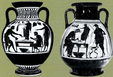
2, 3. Δύο απεικονίσεις υποδηματοποιών την ώρα που παίρνουν μέτρα και κόβουν παπούτσια για παιδιά.