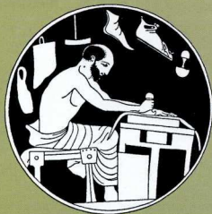
1. Ο υποδηματοποιός την ώρα της δουλειάς του.

Τα γυναικεία υποδήματα ήταν, βέβαια, κομψότερα από τα αντρικά, ενώ τα παιδικά δεν διέφεραν στο σχέδιο από αυτά για ενηλίκους. Ειδικά εργαστήρια κατασκεύαζαν τα περίτεχνα γυναικεία υποδήματα. Υπήρχαν και τα πολυτελή παπούτσια, φτιαγμένα από εισαγμένα λεπτοδουλεμένα δέρματα, ή εισαγμένα έτοιμα, όπως τα "έτρουσκικά" υψηλά υποδήματα, τα "λυδικά σανδάλια" κ.ά. Προφανώς, σε περιοχές με ποιμενική οικονομία αναπτύχθηκαν όχι μόνο βυρσοδεφεία αλλά και