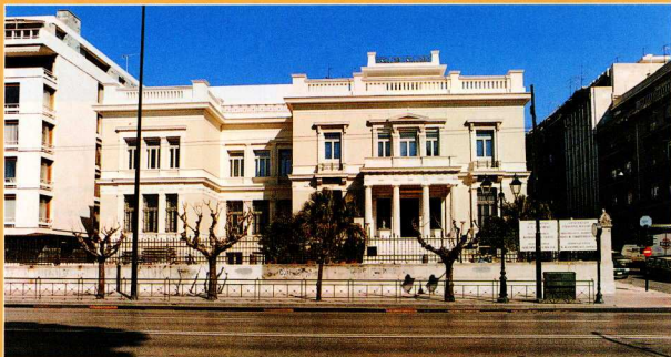
4. Το Μουσείον Μπενάκη μετά την προσθήκη της νέας πτέρυγας και την επισκευή των εξωτερικών του όψεων (Μάρτιος 1997).

19ου αι., που εξακολουθούν να ανθίστανται στην αισθητική αλλοίωση της μεταπολεμικής Αθήνας, μολονότι την κτηριολογική του συγκρότηση σημάδεψε μια αρκετά περιπετειώδης, θα έλεγα, προϊστορία: πυρήνας του υπήρξε ένα ταπεινό, διακριτικού μεγέθους αρχοντικό των μέσων του 19ου αι., το οποίο – όταν η οικογένεια Μπενάκη εγκαθίσταται οριστικά στην Αθήνα στα 1910 – επεκτείνεται με την προσθήκη μιας αίθουσας χορού και με τους απαραίτητους βοηθητικούς χώρους. Τότε εξωραϊζεται εσωτερικά και εξωτερικά με μαρμάρινα νεοκλασικά στοιχεία από τον γνωστό Αθηναίο αρχιτέκτονα και αναστηλωτή του Παναθηναϊκού Σταδίου Αναστάσιο Μεταξά. Στα 1930, για τη μετατροπή της λειτουργίας του κτηρίου σε μουσείο, προστίθεται μια ακόμη πτέρυγα, επειδή όμως ήταν απαραίτητο να εξοικονομηθούν και επιπλέον εκθεσιακοί χώροι, χρησιμοποιείται κάθε προσφερόμενη δυνατότητα, όπως τα ακατάλληλα δωμάτια του υπογείου και η κεντρική αίθουσα της μηνιαιακής εισόδου.