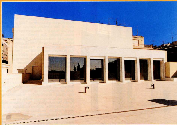
3. Το κυλικείο στην ταράσσα του κτηρίου πριν από την ολοκλήρωση των οικοδομικών εργασιών.