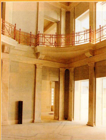
5. Το εσωτερικό αίθριο του Μουσείου.

θα εξακολουθεί να βρίσκεται το παλιό, γνωστό, νεοκλασικό μέγαρο του Μουσείου, με ανανεωμένες όμως και απόλυτα εκσυγχρονισμένες τις κτηριακές του εγκαταστάσεις και με την προσθήκη μιας ολόκληρης νέας πτέρυγας στο, αθέατο από την πρόσοψη του κτηρίου, ελεύθερο πίσω μέρος του οικοπέδου. Το φιλόδοξο αυτό έργο, που ξεκίνησε με την υποστήριξη της Μελίνας Μερκούρη το 1989 και διεκόπη για μια διετία περίπου με ανυπολόγιστες επιπτώσεις, ολοκληρώνεται επιτέλους οριστικά υπό την ακούραστη επίβλεψη του αρχιτέκτονα Αλέκου Καλλιά. Οι ωφέλιμοι χώροι του Μουσείου διπλασιάζονται, φθάνοντας τα 7.000 μ 2 , και, εκτός από τα δύο επιπέδον υπόγεια των αποθηκών στη νέα πτέρυγα, είναι μοιρασμένοι σε πέντε ενιαία επίπεδα: Στο επίπεδο του ημιυπογείου παραμένει επεκτεινόμενη η Βιβλιοθήκη, η Διοίκηση, το Τμήμα των Η/Υ και τα γραφεία των διαφόρων επιστημονικών τμημάτων. Στο επίπεδο του δευτέρου ορόφου και της ταράτσας με το κυλικείο δημιουργείται ένα μικρό auditorium για ηλεκτρονικά πολυμέσα και μια μεγάλη, ανεξάρτητη, ευχάριστη, άνετη αίθουσα πολλαπλών χρήσεων για ποικίλες εκδηλώσεις. Στο υπόλοιπο κτήριο θα αναπτυχθούν οι ελληνικές και μόνο συλλογές, έτσι ώστε να προσφέρουν στον επισκέπτη μια συνολική εικόνα της ιστορικής διαδρομής του ελληνισμού. Μια γενική δηλαδή αίσθηση της διαχρονικής του συνοχής, όπως αυτή αντανακλάται στην αντοχή της γλώσσας και στους ευφάνταστους αναπροσανατολισμούς του καλλιτεχνικού αισθητηρίου.