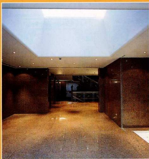
2. Απόψεις της νέας πτέρυγας του Μουσείου Μπενάκη.