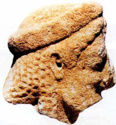
Στάγειρα. Κεφαλή του 6ου αι. π.Χ. από τη διακόσμηση του αρχαϊκού ναού.

Τ α Στάγειρα ιδρύθηκαν από Ίωνες αποίκους της νήσου Ανδρού, γύρω στα 650 π.Χ.. Μετά τους Περσικούς πολέμους έγιναν μέλος της Α' Αθηναϊκής Συμμαχίας, κατά τον Πελοποννησιακό όμως πόλεμο αποστάτησαν από τους Αθηναίους και συμμάχησαν με τους Σπαρτιάτες (424 π.Χ.). Αργότερα η πόλη προσχώρησε στο "Κοινό των Χαλκιδών", που είχε πρωτεύουσα την Όλυνθο, ενώ το 348 π.Χ. υπέκυψε στον Φίλιππο Β', ο οποίος και την κατέστρεψε, για να την επανιδρύσει όμως ο ίδιος λίγα χρόνια αργότερα, προς τιμήν του Αριστοτέλη, δασκάλου του Μ. Αλεξάνδρου. Σύμφωνα με μια παράδοση, λίγο μετά το θάνατο του Αριστοτέλη στη Χαλκίδα (322 π.Χ.), οι Σταγειρίτες μετέφεραν κι έβαψαν το οστά του στην πόλη τους, ιδρύοντας δίπλα στον τάφο του μεγάλο βωμό και καθιερώνοντας μεγάλη