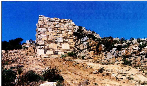
Στάγειρα. Τμήμα της πρώιμης κλασικής οχύρωσης με τετράγωνο πύργο.

Τ α Στάγειρα ιδρύθηκαν από Ίωνες αποίκους της νήσου Ανδρού, γύρω στα 650 π.Χ.. Μετά τους Περσικούς πολέμους έγιναν μέλος της Α' Αθηναϊκής Συμμαχίας, κατά τον Πελοποννησιακό όμως πόλεμο αποστάτησαν από τους Αθηναίους και συμμάχησαν με τους Σπαρτιάτες (424 π.Χ.). Αργότερα η πόλη προσχώρησε στο "Κοινό των Χαλκιδών", που είχε πρωτεύουσα την Όλυνθο, ενώ το 348 π.Χ. υπέκυψε στον Φίλιππο Β', ο οποίος και την κατέστρεψε, για να την επανιδρύσει όμως ο ίδιος λίγα χρόνια αργότερα, προς τιμήν του Αριστοτέλη, δασκάλου του Μ. Αλεξάνδρου. Σύμφωνα με μια παράδοση, λίγο μετά το θάνατο του Αριστοτέλη στη Χαλκίδα (322 π.Χ.), οι Σταγειρίτες μετέφεραν κι έβαψαν το οστά του στην πόλη τους, ιδρύοντας δίπλα στον τάφο του μεγάλο βωμό και καθιερώνοντας μεγάλη