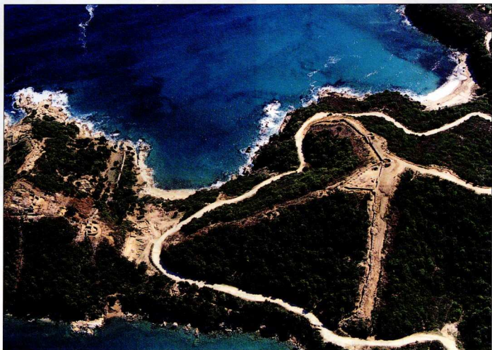
Στάγειρα. Αεροφωτογραφία του αρχαιολογικού χώρου από τα νότια.