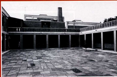
Το κεντρικό αίθριο και η πτέρυγα των περιοδικών εκθέσεων.