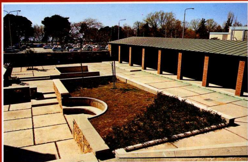
Ο υποαίθριος χώρος όπου θα δημιουργηθούν τα εργαστήρια των εκπαιδευτικών προγραμμάτων.

πανελλήνιος αρχιτεκτονικός διαγωνισμός, στον οποίο το πρώτο βραβείο απέσπασε η μελέτη του αρχιτέκτονα Κυριάκου Κρόκου. Στον ίδιον ανατέθηκε και η σύνταξη της οριστικής μελέτης. Διοικητικές εμπλοκές στο θέμα της παραχώρησης του οικοπέδου από το Ταμείο Εθνικής Αμύνης στο οποίο ανήκε, καθυστέρησαν την έναρξη του έργου. Το Μουσείο τελικά θεμελιώθηκε το Μάρτιο του 1989 από την τότε υπουργό Πολιτισμού Μελίνα Μερκούρη. Ολοκληρώθηκε και παραδόθηκε τον Οκτώβριο του 1993. Τα επίσημα εγκαινία του έγιναν το Σεπτέμβριο του 1994 με μια περιοδική έκθεση που οργανώθηκε για την περίσταση.