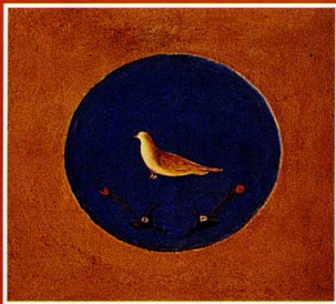
Η τοιχογραφία του Γέννη Ζήτα στο κεντρικό αίθριο.

Η σύλληψη ίδρυσης "Κεντρικού Βυζαντινού Μουσείου" στη Θεσσαλονίκη ανήκει στον Γενικό Διοικητή Μακεδονίας Στέφανο Δραγούμη, ο οποίος, σε σχετική απόφαση (αρ. 746/21-8-1913), όρισε ως τόπο εγκατάστασής του το ναό της Αχειροποιήτου. Το Σεπτέμβριο του ίδιου χρόνου ο καθηγητής βυζαντινής τέχνης και αρχαιολόγος Αδαμάντιος Αδαμαντίου, σε σχετικό υπόμνημά του προς το Δραγούμη "Περί ιδρύσε-