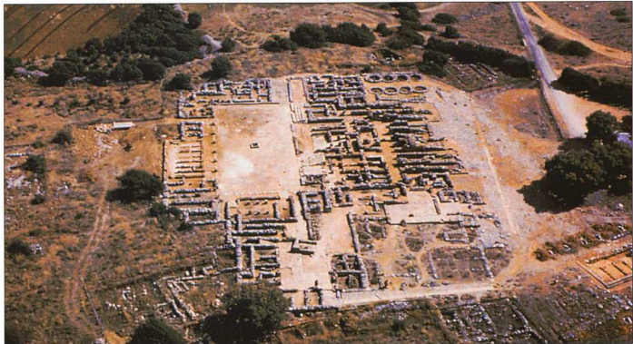
3. Μάλια. Αεροφωτογραφία του ανακτόρου.

Ήδη από το 1850, όταν η ΓΑΣ τίθεται υπό την πνευματική κηδεμονία της Académie des Inscriptions et Belles-Lettres, ο ορίζοντας των νέων μελών διευρύνεται και γίνεται αντιληπτό ότι η Κρήτη, που τότε ανήκε στην Οθωμανική Αυτοκρατορία, αποτελεί χώρο ιδιαίτερου ενδια-