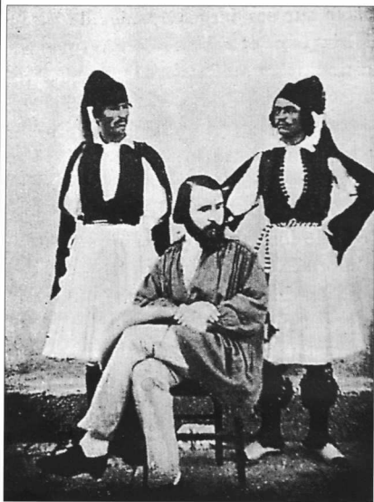
7. Μέλη του ελληνικού προσωπικού της Σχολής πλαισιώνουν τον Eug. Gandar (1850).