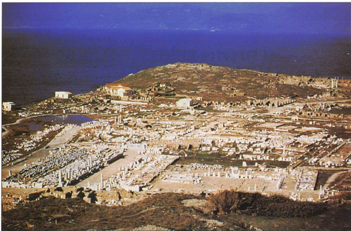
2. Δήλος. Το ιερό του Απόλλωνα στο κέντρο της πόλης.