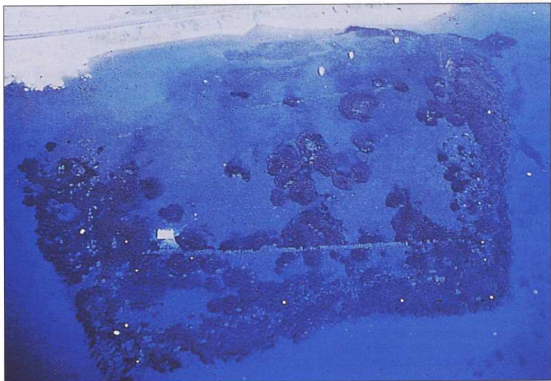
5. Αμαθούς, Αεροφωτογραφία του λημέρος.

Οι ανασκαφές που πραγματοποιούνται στην Αμαθούνα από το 1974 οφείλονται σε ιδιαίτερες συνθήκες και στο διορατικό πνεύμα ενός από τους διευθυντές της Σχολής. Οι δραστηριότητες της ΓΑΣ