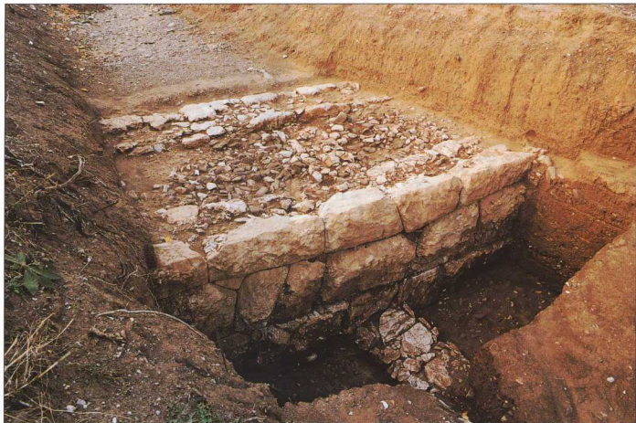
Τμήμα του οχυρωματικού περιβόλου, στην κοίτη του ποταμού Κορνέσιου.

577 περίπου στρέμματα. Τα ανασκαφέντα τμήματά του χρονολογούνται στους ελληνοιστικούς χρόνους, με ανατειχισμό και μετασκευή σε ορισμένες περιπτώσεις σε σχέση με την κυρίαρχη φάση. Διατηρείται η λίθινη κρηπίδα, κτισμένη κατά το ακανόνιστο ανισόδομο σύστημα, με τοίχους στις εξωτερικές επιφάνειες από πλίνθους ντόπιου αμιγδαλίτη λίθου, και στο μεταξύ αυτών κενό με κροκάλες και λατύπη. Η τοιχοδομία του συμπληρώνεται από κατά διαστήματα εγκάρσιους τοίχους (τα ζεύγματα), οι οποίοι έδεναν τις εξωτερικές παρείες. Το εποικοδόμημα του λιθόκτιστου τμήματος ήταν από πλίθρες. Αυτό επιβεβαιώνεται από την ανασκαφική έρευνα στην οχυρωματική εγκατάσταση της ΝΔ πύλης, όπου εντοπίσαμε τα κενά από τους προϋπάρχοντες εγκάρσιους ξύλινους ενδέσμιους (κοινώς ξυλοδεσιές) που συγκρατούσαν το σώμα των ωμών πλίνθρων.