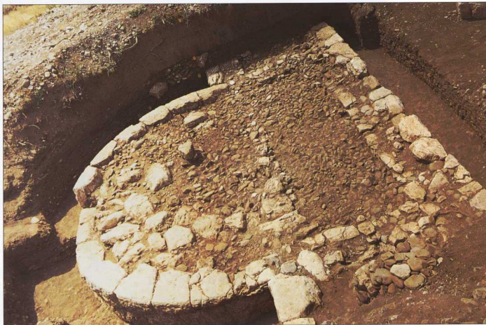
Κεραμικός κλιβάνος στη θέση Καταράχης.

ροθετηθεί το θέατρο, όπου πραγματοποιήθηκε μικρή δοκιμαστική έρευνα με στόχο την ανίχνευση του κούλου του. Η αποσπασματικότητα των στοιχείων που προέκυψαν δεν επιτρέπει να εντοπίσουμε προς το παρόν το κέντρο του και να προσδιορίσουμε την κλίμακα αλλά και τον βαθμό διατήρησης του μνημείου. Η υπό εξέλιξη ανασκαφή του ελπίζουμε να είναι περισσότερο διαφωτιστική στο μέλλον.