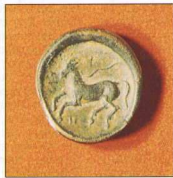
Χάλκινος αοβάλος, 370-240 π.Χ. Εμπροσθέντος: Αθηνά με κέρατος με λοφίο, σε πλάγια όψη, ελαφρώς στραμμένη προς τα πίσω. Οπισθόντος: ιππός κολπάζων με λυμένο χελένο.