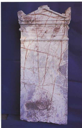
Επιτύμβια στήλη με ιωνικό ανακλινηροειδές (Sofa kapitell) επικρῶνο.

Πολλοί ξένοι περιηγητές—όπως οι Lebas, Curtius, Leake, Bursian, Fraser, Vischer, Dodwell και άλλοι—, καθώς και ο ιστοριοδίφης γυμνασιάρχης Παπανδρέου, οι οποίοι επισκέφθηκαν την περιοχή, στηρίζονται στα φαινόμενα ερείπια και τις αρχαίες πηγές, διατύπωσαν διάφορες προσωπικές απόψεις για την μνημειακή τοπογραφία της. Στα 1940, κάποια απόπειρα ανασκαφής στο αρχαίο θέατρο της πόλης από Ιταλούς ματαιώνεται. Πολύ αργότερα, το 1987, μέσω της ΣΤ' Εφορείας Προϊστορικών και Κλασικών Αρχαιοτήτων, αρχίζουμε τις εργασίες υποδομής για ένα μακροπρόθεσμο ερευνητικό πρόγραμμα με στόχο τη μελέτη του πολεοδομικού ιστού της πόλης και τη σταδιακή αποκάλυψη των λειψάνων της. Ακολουθεί ανασκαφική έρευνα, δοκιμαστικού κατ' αρχήν χαρακτήρα (1988), η οποία συστηματοποιείται στο χώρο ανάμεσα στην ΝΔ πύλη του τείχους και το θέατρο (1989 και 1992). Όμως στο τέλος του