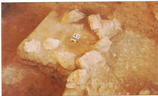
3. Η κυκλωτερής κατασκευή της ενότητας IIIc.

τεχνική της λεπίδας στην ουσία εξαφανίζεται στην ενότητα III, με την εξαίρεση μερικών υπερ-μικρολιθικών μικρολεπίδων κατασκευασμένων από τα μέτωπα των υψηλών Ξέστρων. Αυτές οι μικρολεπίδες, εξάλλου, δεν φέρουν δευτερογενή επεξεργασία, και πιθανόν δεν έχουν ποτέ χρησιμοποιηθεί. Επιπλέον έχουμε τρεις οστέινες λύγχες, αρκετά μικρές, πεπλατυσμένης τομής και με συμπαγή βάση (χωρίς σχισμή).