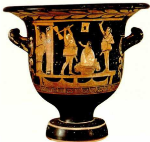
2. Ερυθρόμορφος κρατήρας με σκηνές της γέννησης της Ελένης, 4ος αι. π.Χ. Αρχαιολογικό Μουσείο Βασι.

που εγκαταστάθηκαν στη δυτική Μεσόγειο και υπήρξαν οι πioniέροι του οργανωμένου αποικιακού κινήματος που άρχισε τον 8ο αι. π.Χ. (εικ. 13). Ως το τέλος του 8ου αι. η ίδρυση αποικιών διαδέχεται με γοργό ρυθμό η μία την άλλη. Οι Κορινθίοι ιδρύουν τις Συρακούσες (734), οι Χαλκιδείς την Κάρτην (729), οι Αχαιοί τον Κρότων (708) και την Ποσειδωνία (600), οι Σπαρτιάτες τον Τάραντα (706), οι Ερετριείς την Κύμη (750) και τη Νεάπολη (650), οι Ρόδιοι την Παρθενόπη (700) και τον Ακράγαντα (580). Η εύφορη, ο πλούτος του υπεδάφους, τα προστατευμένα λιμάνια εκλύουν χιλιάδες αποίκους, και σύντομα πολλές από τις καινούργιες πόλεις ξεπερνούν σε πλούτο και μεγαλοπρέπεια τις μητροπόλεις τους. Η οικονομική ευημερία συνοδεύεται συνήθως από καλλιτεχνική άνθιση. Έτσι οι αποικίες γίνονται πόλεις έλξης για τους ανθρώπους της τέχνης και του πνεύματος και έχουν να επιδείξουν μια εξαιρετική εικαστική παραγωγή, η οποία παρουσιάζεται ολοκληρωμένα και εμπειριστατωμένα μέσα από τα 2000 εκθέματα που προέρχονται από 75 διαφο-