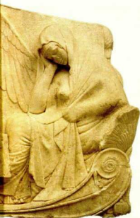
7. Άγαλμα κορυπίδας από ασβεστόλιθο, περ. 300 π.Χ. Από την κωμόπολη του San Cipirella.

Θα ήταν εξάλλου παράλειψη να μην τονιστεί η τεράστια ανάπτυξη της φιλοσοφίας και των άλλων επιστημών στις ελληνικές αποικίες, που σφείλουν τον πλούτο και τη φήμη τους όχι μόνο στο εμπορικό δαιμόνιο των κατοίκων αλλά και σε ένα σύνολο πνευματικών και καλλιτεχνικών δραστηριοτήτων που τις χαρακτήρισαν και άφησαν το στίγμα τους στην ιστορία. Αυτά τα βασικά στοιχεία που συγκροτούν έναν πολιτισμό αλλά που δεν μπορούν να εκτεθούν ως αντικείμενα σε προθήκες, παραλαμβάνουν στους τοίχους των αιθουσών με τη μορφή ενός "ενημερωτικού άτλαντα". Μιας παράλληλης διαδρομής που παρέχει στον θεατή όλες τις χρήσιμες πληροφορίες για την κατανόηση και την προσέγγιση της αρχαίας κοινωνίας. Τα εκθέματα συνοδεύονται από αναλυτικές και λεπτομερείς αναφορές στη φιλοσοφία, τη λογοτεχνία, την αρχιτεκτονική, τη ναυσιπλοΐα, το θέατρο, τη θρησκεία, τη μυθολογία, την πολιτικο-κοινωνική δομή. Αυτή είναι άλλωστε και μια από τις καινοτομίες της έκθεσης: τα