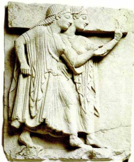
12. Μετόπη με χορό κερσάρων, 510-500 π.Χ. Αρχαιολογικό Μουσείο Paestum.