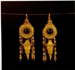
9. Χρυσά σκουλαρίκια διακοσμημένα με μαργαριτάρια και κόκκινους λίθους 2ος αι. π.Χ. Αρχαιολογικό Μουσείο Bari.