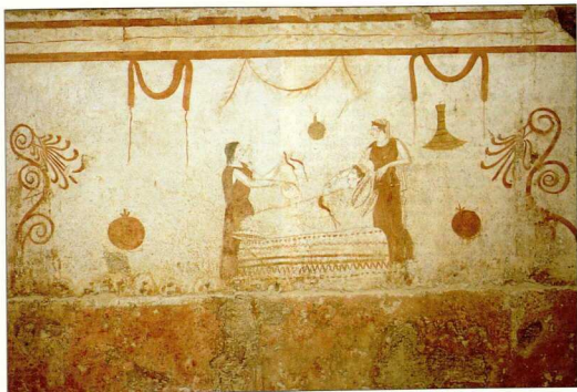
8. Επτάφυα ασβεστολιθική πλάκα με ζωγραφική παράσταση "πρόθεσης", 340-330 π.Χ. Αρχαιολογικό Μουσείο Paestum (αρχαία Ποσειδωνία).

κυρίως Ελλάδα και δεν αποτελούν δείγμα της μεγαλοελλαδίτικης παραγωγής. Μια πλειάδα μπρούτζινων αντικειμένων μάς αποζημιώνει γι' αυτή την απώλεια. Αγαλματίδια (εικ. 3, 4), δοχεία, σκαλιστοί καθρέφτες και δύο εκφραστικότερα κεφάλια γενειοφόρων ανδρών (εικ. 10), που είναι γνωστοί ως "φιλόσοφοι", για να μας θυμίζουν τους μεγάλους φιλοσό-