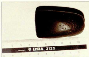
3. Οστράκα αγώνιων από τη θέση "Πλάτη Μιστεγγών". 4. Πέτρινα ούνα από πρώτο βασάλτη.