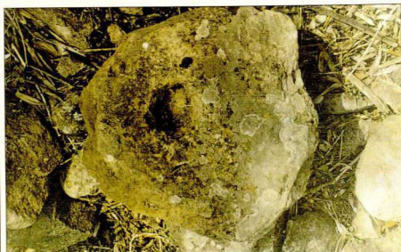
1α. "Πλάτη Μιατεγγών".