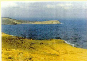
1. Ακρωτήρι "Πόχη".