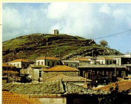
6. Αι-Λιας, Αγίας Παρασκευής.