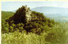
8. Βράχος του διαβόλου.