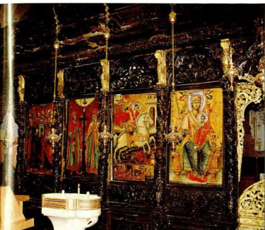
Αριστερό τμήμα τέμπλου μετά τη συντήρηση.