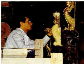
Χρήση πολυουρεθάνης κατά τη διάρκεια της συντήρησης.