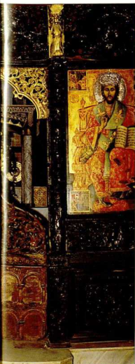
Κεντρικό βιβλιόφυλλο κατά τη διάρκεια της συντήρησης.