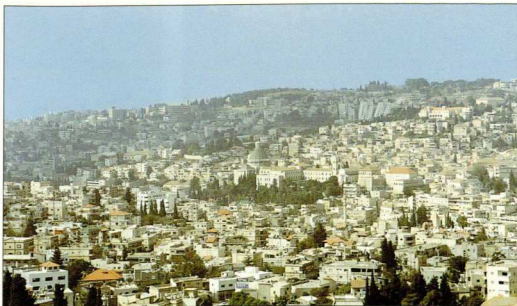
Γενική άποψη της σημερινής Ναζαρέτ.

Η Ναζαρέτ σήμερα, με 70.000 περίπου κατοίκους, είναι ένα ετερόκλητο σύνολο εθνών και θρησκειών με ξεχωριστά κέντρα και τόπους λατρείας. Έτσι, δίπλα στους Μουσουλμάνους, τους Άραβες και τους Εβραίους, βρίσκονται Χριστιανοί Ορθόδοξοι, Ρωμαιοκαθολικοί, Μαρωνίτες, Δρούσοι και άλλοι.