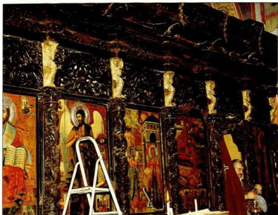
Δεξιό τμήμα τέμπλου μετά τη συντήρηση.