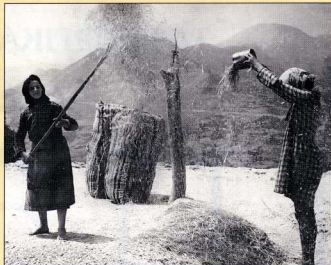
21. Λίχνισμα (Δ. Τλούπας).

(18.1. κ.ε.ξ.) παρέχονται οδηγίες για τον καλό θερισμό· ο Όμηρος χαρακτηρίζει στην Ὀδύσεια το δρέπανον εὐκαμπές , δηλαδή καλώς καμπυλωμένο, ενώ στην Ίλιάδα (Σ 550) περιγράφει, στην ασιπίδα του Αχιλλέα, θερισμό με "ὄξειας δρεπάνας".