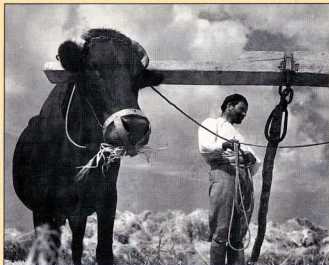
19. Αλώνισμα (Nelly's). Έως τη χρήση των μηχανικών μέσων το αλώνισμα των νεότερων χρόνων, αίγουρο, δεν διαφέρει από εκείνο της αρχαιότητας.