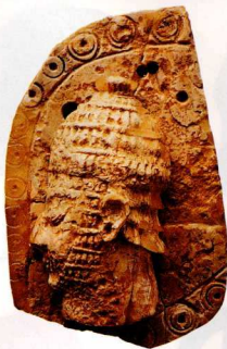
35. Ελεφάντινο ανάγλυφο από λαβή υποποδίου, όπου εικονίζεται κεφαλή πολεμιστή με κράνος από χαυλιόδοντες κάρπου.