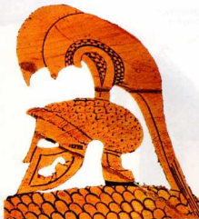
39. Τρία λοφία διαφορετικών σχημάτων, μονά και διπλά.