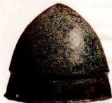
38. Χάλκινα κράνη: α. κορινθιακό, β. ιλλυρικό, γ. ιωνικό, δ. ιωνικό (αρύβαλλος σε σχήμα κρονοφόρου κεφαλής πολεμιστή).