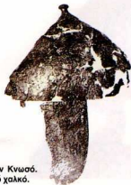
36. Κράνος που βρέθηκε στην Κνωσό. Είναι ολόκληρο καλυμμένο από χαλκό.