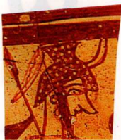
37. Το γνωστό "αγγείο των πολεμιστών", στο οποίο εικονίζονται άλλοι τύποι, ίσως κι αυτοί μεταλλικοί («Οπλισμός» 1, τεύχος 50, σελ. 113).