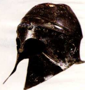
40. Χαλκιδικό-κορινθιακό κράνος του Μουσειού της Ολυμπίας.