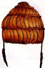
34. Κράνος από χαυλιόδοντες κάρπου, η ομηρική κ υ ν έ η, αποκαταστημένο.