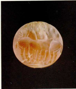
Φακελίδες σφραγισμένες με παράσταση ζώων από τον Θολωτό Τάφο Α στο Φουρνί.