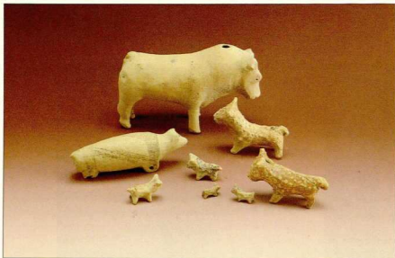
Πήλινα ειδώλια και μυτά σε σχήμα ταύρων από διάφορα τμήματα του νεκροταφείου στο Φουρτί.

ντρες, ορεία κρύσταλλο, στεατίτη, φαγεντιανή, όστρεα, αργυρά δαχτυλίδια και λίθινα αγγεία 1 . Χαρακτηριστικό των πρωτοανακτορικών αποθέσεων είναι ο μεγάλος αριθμός και τα είδη των πήλινων αγγείων καθώς και η παρουσία ανθρώπιμορφων και πτηνόμορφων πήλινων ειδωλίων και ρυτμών με μορφή ταύρου, όμοιων με αυτά που βρέθηκαν σε σύγχρονα ιερά κορυφής. Οι μεμονωμένες ταφές συχνά επισημαινόταν με ένα κύπελλο ή μία πρόχου και ίσως οστά ζώων (στα οποία συμπεριλαμβάνονταν πουλιά και ψάρια), λεπίδες οψιανού, βότσαλα και όστρεα. Μια μεμονωμένη παιδική ταφή σε αγγείο, με ένα αργυρό δαχτυλίδι, ένα κύπελλο και τρία θυσιασμένα ζώα, θα μπορούσε να ερμηνευθεί ως μία περιπτώση κληρονομική μεταβιβαζόμενου πλούτου.