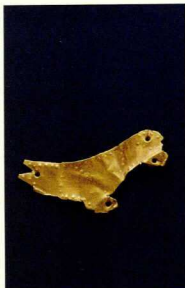
Χρυσό έλασμα σε σχήμα πουλιού από το Τηκό Κτήριο 13 στο Φουρνί.

Το 1972 ο Γ. και η Ε. Σακελλαρόκη ήταν οι πρώτοι αρχαιολόγοι που υπέθεσαν, με βάση τα ευρήματα από τον Θολωτό Τάφο Γ στις Αρχάνες, ότι νησιώτες είχαν εγκατασταθεί εκεί στη διάρκεια της ύστερης προανακτορικής εποχής 17 . Σήμερα υπάρχουν περισσότερα στοιχεία που ενισχύουν αυτήν την υπόθεση. Οι κβαντισμοί τάφοι, μια κυκλαδική μορφή ταφής, παρουσιάζονται για πρώτη φορά στην Κρήτη στη διάρκεια της MM Ια, σε πολλές θέσεις κατά μήκος της βόρειας ακτής, στις Αρχάνες («Περιβολιον», στα Μάλια, στην Ψείρα, στον Σφυγγαράκι και στη Ζάκρο) 18 . Οι ταφές σε πιτύους, χαρακτηριστικές της Δυτικής Ανατολίας (και σπάνιες στο Αιγαίο), εμφανίζονται αυτήν την εποχή κατά μήκος ολόκληρης της βόρειας ακτής της Κρήτης, από τα Χανιά ως την Ζάκρο 19 . Στη διάρκεια της MM Ια τα αγεία κυκλαδικού ρυθμού της Κνωσού κατασκευάζονται από εγχώριο πηλό 20 . Η υπόθεση ότι οι κρητικοί οικισμοί αναπτύχθηκαν στη διάρκεια της MM Ια, εν μέρει λόγω εμποικής, συμφωνεί με τα στοιχεία που προκύπτουν από τα νησιά του Αιγαίου και την δυτική Ανατολία, που αυτή την εποχή παρουσιάζουν ενδείξεις αναταραχών και