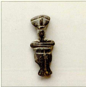
Μικροσκοπικό λίθινο πεπίπτο σε σχήμα ανθρώπινης μορφής από τον Θαλωτό Τάφο Γ στο Φουρνί.

ραλληλιζόντας το με τα πολυάριθμα βασιλικά ανάκτορα της Βρετανίας. Ωστόσο, φαίνεται περισσότερο πιθανό ότι ο τοπικός άρχων των Αργαίων συγγένευε με τη δυναστεία της Κνωσού και διατηρούσε ένα ημι-αυτόνομο καθεστώς, όπως ίσως εκείνο πολλών κρατών της Συρίας κατά την Ύστερη Χαλκοκρατία. Χωρίς τον εντοπισμό γραπτών κειμένων, ίσως να μη γίνει ποτέ γνωστή η ακριβής πολιτική σχέση αυτών των δύο μινωικών κέντρων.