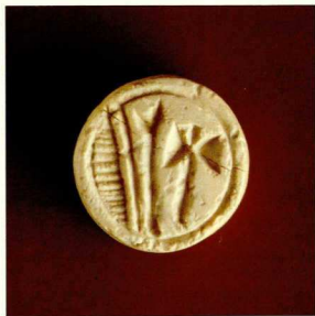
Ελεφαντίνη σφραγίδα με ιερογλυφικά από το Ταφικό Κτήριο 6 στο Φουρνί.