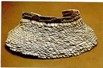
33. Περιλοιμία θώρακας από δέρμα και χάλκινες επιχρυσωμένες φολίδες, από το Δερβένι (β' μισό του 4ου αι. π.Χ.).

Στη Γεωμετρική εποχή (725 π.Χ.) ανήκει καμπανόσχημος, πλήρης θώρακας από ορείχαλκο, που βρέθηκε στο Άργος (εικ. 28). Το μήκος του έφτανε τα 49 εκ. Ο πλήρης θώρακας, που προσέφερε τη μεγαλύτερη προστασία σε σχέση με τους άλλους τύπους θωράκων, χρησιμοποιήθηκε στην Ελλάδα επί δύο περίπου αιώνες. Τον θώρακα συμπλήρωναν οι επιωμίδες , δύο σταθερά προσαρμοσμένες στο πίσω γυάλο μεταλλικές πλάκες, που δένονταν στο μπροστινό γυάλο. Τα όπλα που δένονταν στο κάτω μέρος του στέρνου, έως τον λαϊμό. Άλλο μέρος του θώρακα ήταν οι πτερυγες , δερμάτινα γλωσσίδια ή μικρές μεταλλικές πλάκες που, σε μία ή σε δύο σειρές, προσαρμόζονταν στο κάτω άκρο του θώρακος, για να προστατεύουν το κάτω μέρος του κορμού (εικ. 29, 30, 32). Παρόμοια εξαρτήματα προσαρμόζονταν καμιά φορά και στον δεξιό ώμο, ώστε να προστατεύεται ο πολεμιστής όταν σήκωνε το δεξί του χέρι για να χτυπήσει τον εχθρό. Άλλο εξάρτημα του θώρακα ήταν το περιλοιμία (εικ. 33), για συμπληρωματική προστασία, καθώς και η μίτρα , που ήταν μεταλλική πλάκα η οποία προσαρμόζονταν στο μπρος κάτω μέρος του θώρακος ή την έδεναν στη μέση.