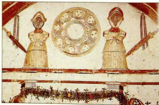
32. Τοιχογραφία του τάφου του Λύσινας και Καλλικλέους (τέλος 2ου αι. π.Χ.), όπου εικονίζονται τα όπλα των Μακεδόνων πολεμιστών.