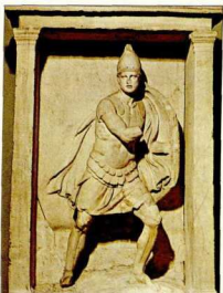
30. Στο ανάγλυφο του Αριστοναούτου φαίνεται καθαρά ο θώρακας με δύο σειρές γλωσσίδες στο κάτω του μέρος (4ος αι. π.Χ.).