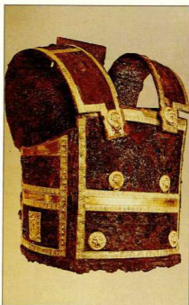
31. Στον μεγάλο τάφο του τύμβου της Βεργίνιας ήταν τοποθετημένα τα όπλα του νεκρού, μεταξύ των οποίων και ο σιδερένιος θώρακας με τη χρυσή διακόσμηση από ταινίες και διακόρη με λεοντοκεφαλές (4ος αι. π.Χ.).