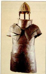
27. Πλήρης χαλκή πανοπλία από θαλαμοειδή τάφο των Δένδρων της Αργολίδας (περ. 1425 π.Χ.).