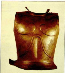
28. Πλήρης κωδωνόσχημος θώρακας, που βρέθηκε σε υστερογεωμετρικό τάφο του Αργούς (650-625 π.Χ.).