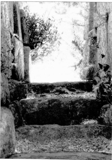
Μια από τις "Πόρτες" του αρχαίου τείχους της πόλης που βρίσκεται στο σημερινό χωριό Παλαιομάνινα Ακαρνανίας. Είναι μία από τις Πόρτες που έχει σχήμα ορθογώνιο. Η άλλη έχει σχήμα «καμάρας». Κι εκείνη περιβάλλεται από θάμνους, χάρτα και ... δέντρα...

Δεν υπάρχει μόνο δικαστική πλάνη. Υπάρχει και ...αρχαιολογική πλάνη. Ο γράφων δεν είναι ειδικός αρχαιολόγος ή ιστορικός. Είναι δημοσιογράφος και ελπίζω ότι τα ιστορικά και πραγματικά στοιχεία που θα παρουσιάσω θα προκαλέσουν το επιστημονικό ενδιαφέρον των ειδικών για περαιτέρω έρευνα και για αποκατάσταση της ιστορικής πραγματικότητας. Τα στοιχεία αυτά είναι τα εξής: