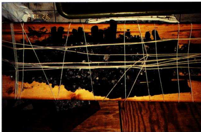
3. Πλοίο «La Thèrèse»: Τμήμα ξύλινου βαρελιού με πυρίτιδα. Διαδικασία ανέλκυσης (σήμερα βρίσκεται υπό συντήρηση στα εργαστήρια έμφυδρου ξύλου της Ε.Ε.Α.).

ρωματικών τειχών της πόλης περικλείουν το λιμάνι στο εσωτερικό τους, έτσι ώστε να σχηματίζεται "λιμνή κλειστός", γνωστός ως ο πολεμικός λιμένας της Κλασικής περιόδου. Μέχρι σήμερα έχουν ανασκαφεί δύο από τους έξι οχυρωματικούς πύργους του λιμανιού, τμήμα της προκυμιάς, μία οχυρωματική πύλη και μεγάλο κρηπίδωμα σε μικρότερον εσωτερικό λιμένα.