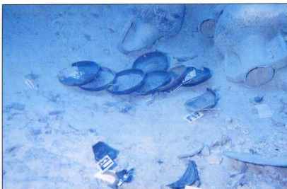
1. Αλόννησος: Αγγεία in situ, στο κλασικό ναυάγιο.