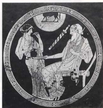
7. Στο αττικό αυτό αγγείο βλέπουμε μια ειρηνική σκηνή, όπου το ξίφος βρίσκεται μέσα στον κολοό.