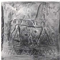
5. Γύρω και μέσα στον Δούρειο ίππο, οι πολέμιστές με τα όπλα τους. Βλέπουμε δύο ξίφη, μέσα στους κολοούς τους, που τα κρατούν από τον τελαμώνια οι Έλληνες πολεμιστές (πίθος της Μυκόνου, πρώτο ήμισυ του 7ου αι. π.Χ.).