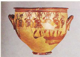
2. Στο μυκηναϊκό αγγείο, το επονομαζόμενο "κρατήρ των οπλιτών" (1200-1190 π.Χ.), μπορούμε να παρατηρήσουμε τον οπλισμό της εποχής (Εθνικό Αρχαιολογικό Μουσείο).