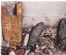
1. Βεργίνα. Στον προθάλαμο του μεγάλου τάφου βρέθηκαν τα όπλα του νεκρού. Εδώ βλέπουμε τις κνημίδες και τον γυρτώ (θήκη για τα βέλη, που έφερε ο πολεμιστής στην πλάτη).