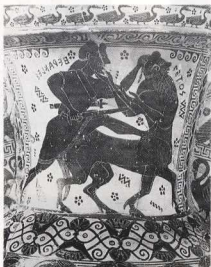
6. Στον αττικό αμφορέα του τέλους του 7ου αι. π.Χ. βλέπουμε τον Ηρακλή που σκοτώνει, με το ξίφος του, τον Νέσσο. Ο κολοός κρέμεται, από τον τελαμώνια, πίσω από τον ώμο του.