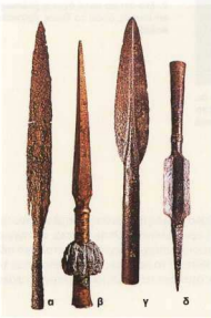
3. Όπλα: α-β. Δύο αιχμές δόρατος, αντίστοιχα, της γεωμετρικής και της αρχαϊκής περιόδου. γ-δ. Αιχμή και σαρωτήρ σάρισσα της μακεδονικής φάλαγγας (Ιστορία Ελληνικού Έθνους, Εκδοτική Αθηνών, τόμ. Γ2).