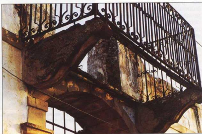
5. Μπαλκόνι σε σπήτι του Πορτιανού. Έργο Λιάπη.

στην Παναγιά του Τσα (Μύρινα), στις εκκλησίες του Παλιού Πεδιού και της Πλάκας.