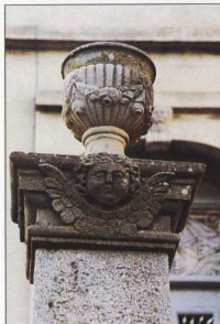
6-7. Γλυπτός διάκοσμος σε αρχοντικό του Κονιά. Έργο Τάσου Ανηβελάκη.