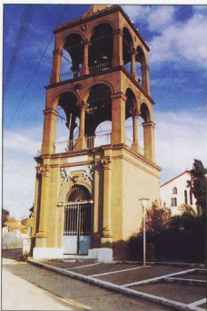
1. Το πέτρινο καμπαναριό του Αγίου Γεωργίου Αιολικής. Έργο Ι. Φωτιάδη.

Τον πρώτο λόγο στη διαδικασία του πελεκήματος της πέτρας τον είχε ο μάστορας, δηλαδή ο επικεφαλής της ομάδας, που ήταν κατά κανόνα και ο πιο ηλικιωμένος. Η τέχνη του συνήθως πήγαινε κληρονομικά. Ο πατέρας είχε κοντά του το γιο ή τους γιους του, που τον βοηθούσαν μαθαίνοντας συγχρόνως και τα μυστικά της δουλειάς. Και πρόκειται πράγματι για πολύτιμα μυστικά –αποτέλεσμα μακροχρόνιας συσσωρευμένης πείρας. Αναφερόμενοι εδώ ενδεικτικά σε μια μόνο περίπτωση, στην κατασκευή τζακιών, θα πρέπει να πούμε ότι οι πετράδες όχι μόνο τα πελεκώσαν, αλλά ήταν αυτοί οι ίδιοι που