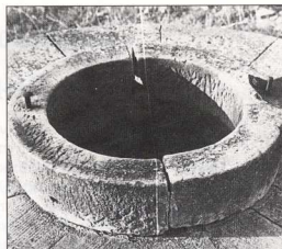
10. Πέτρινο πηγάδι στο Πορτανού. Έργο Π. και Δ. Βόγδανου.