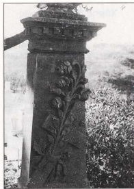
12. Μνήμη στο νεκροταφείο του Πορτανού. Έργο Τ. Ανηβελάκη.