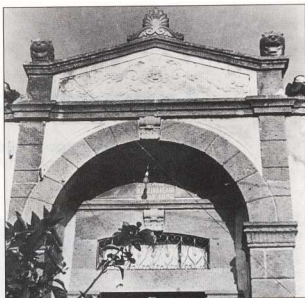
4. Πελοπνητική πρόσοψη σπιτιού στα Τσιμάνδρια. Έργο Πάρη και Δημήτρη Βόγδανου.

Δεν δημιουργούσαν όμως οι πετράδες μόνο για τους ζωντανούς. Σε κάθε χωριό, δουλεμένα απ' το χέρι τους, στέκονται σεμνά και λιτά ηρώα, που εκφράζουν την ευγνωμοσύνη των κατοίκων στα παλικάρια τους. Στεφάνια δάφνινα που πέτρωσαν, θυμιάμα που μένει για πάντα στον αιθέρα, και άλλα συναφή θέματα στολίζουν τα μνημεία αυτά (εικ. 11). Έχει και τους κοινούς νεκρούς της κάθε κοινότητας. Και γι' αυτούς σμίλεψαν οι πετράδες τάφους κοσμημένους με πέτρινα αγγελοῦδια, γλάστρες, λουλούδια, άγκυρες, και άλλες παρόμοιες μορφές και σύμβολα.