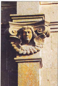
2. Λεπτομέρεια του καμπαναριού του Αγ. Γεωργίου Αιολικής.

τα τοποθετούσαν κιόλας με επιδεξιότητα και γνώση, έτσι ώστε να μην καπνίζουν, με ό,τι καιρό κι αν έκανε.