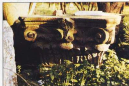
8-9. Κεφάλια κορών και κιονόκρονα στην Ασιακή (ημιτελή κομμάτια). Έργο Ι. Φωτιάδη.