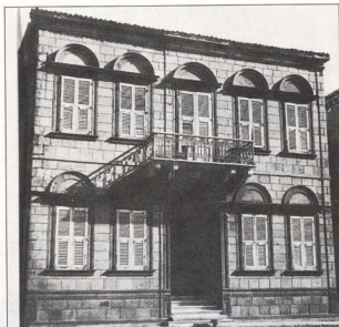
3. Πέτρινο αρχοντικό στο Ρωμείο Γιάλο της Μύρινας.