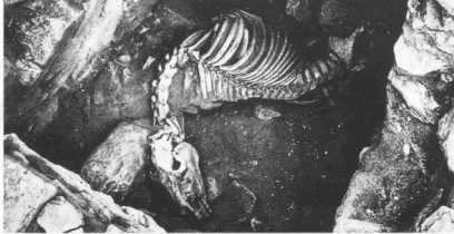
Προϊστορικοί τύμβοι Μαραθώνα (Σ. Μαρινάτος, 1970).

Στον μυχό της κοιλάδας του Βρονιά εντοπίστηκαν τέσσερις ταφικοί τύμβοι. Ο λακκοειδής τάφος III του πρώτου τύμβου περιείχε σκελετό αλόγου του είδους Przewalski . Η αποκοπή δύο ποδιών του ζώου θεωρήθηκε από τον ανασκαφέα στοιχείο θυσίας 6 . Οστά αλόγων προέρχονται επίσης από την Λέρνα και την Τροία (φάσεις IV και VI) 8 . Στη θέση της Πελοποννήσου πραγματικό άλογο, και όχι κάποιο συγγενές είδος, εντοπίζεται στη φάση V, ενώ στη φάση VII τρία οστά φέρουν ίχνη από αιχμηρό εργα-