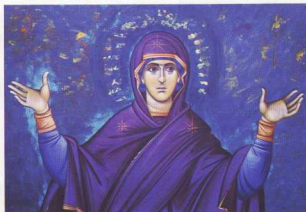
7. Πλατυτέρα (μεικτή τεχνική).