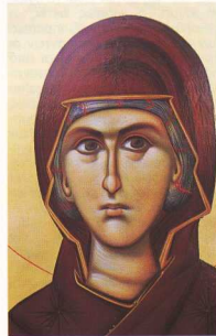
6. Παναγία με πορφύρα (αυγοτέμπερα).