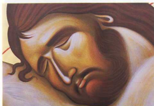
1. Ολοκλήρωση (μεικτή τεχνική).