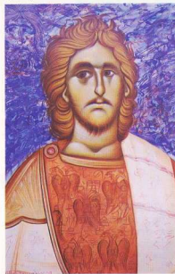
4. Τρεις πολιτικοί (αυγοτέμπερα).

πτομέρεια ενυπάρχει ως σπέρμα το φως της ολότητας, το δονούμενο πάθος για ολοκλήρωση, για να μας θυμίζει ότι ο άνθρωπος βρίσκεται διαρκώς σε απώλεια. Όμως αυτός δεν είναι ο προορισμός αλλά η προσπάθεια της αναδόμησής της εντός του και εκτός αυτού ύλης. Αυτή είναι η εσχάτη προσπάθεια της απελευθέρωσής του.